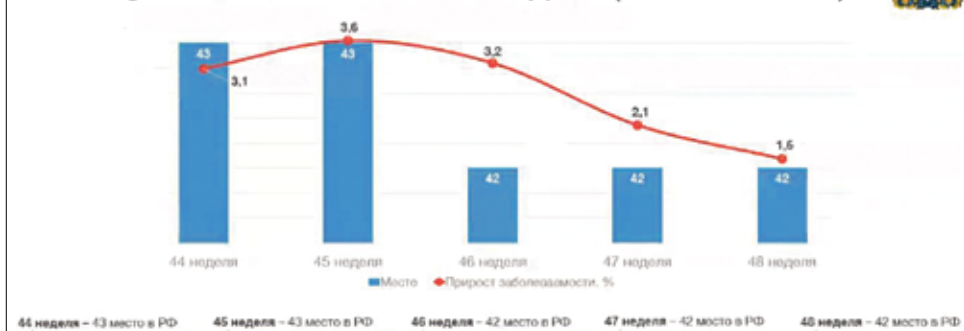
Заболеваемость COVID-19 в Российской Федерации и в Калужской области 44-48 неделя (05.11-02.12.21)*

— Ее необходимо довести до абсолютно хороших результатов, хотя и сегодня видно, что эффект от проведенной работы есть, — подчеркнул глава региона.