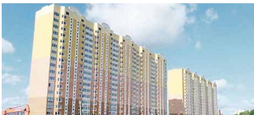
➤ На Поленова, 6 начаты масштабные ремонтно-восстановительные работы отопительной системы