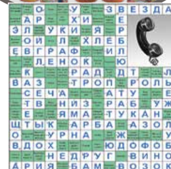
Ответы на сканворд № 28 (788) от 22.07.2021