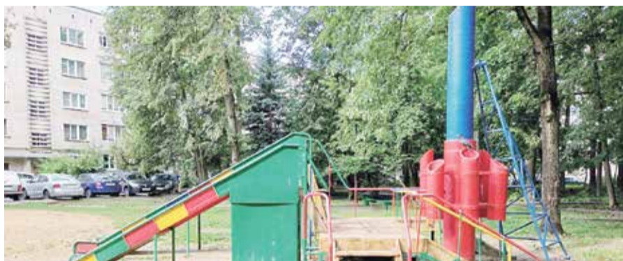
➤ Обновлённая детская площадка на Аксёнова, 7