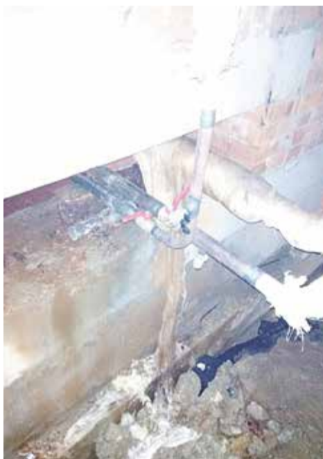
➤ Капитальный ремонт инженерных сетей на Белкинской, 23Б