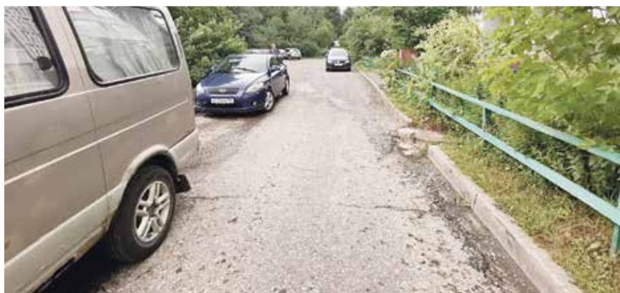
➤ Зимой дорогу чистили не часто...