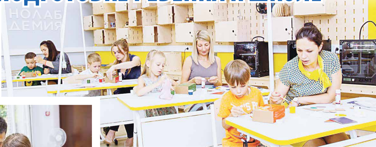
➤ Одно из занятий прошло с участием родителей, которые помогли детям выполнить творческое задание