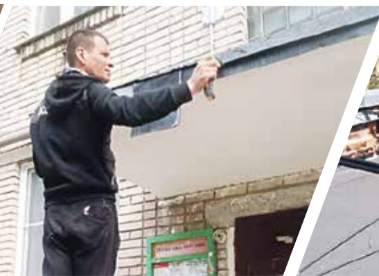
► Ремонт козырька на Энгельса, 19А