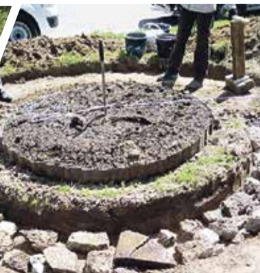
► Изготовление клумбы на Энгельса, 20