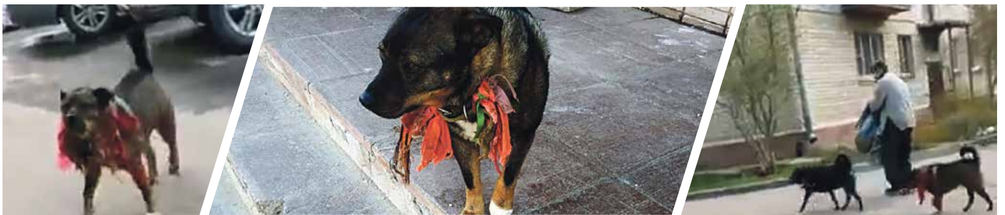
► Жителей Обнинска пугают агрессивные псы без намордников