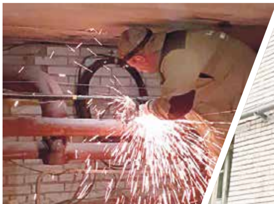
► На Маркса, 73 каким-то образом в трубе очутилась бутылка!