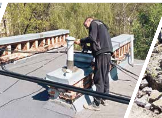
► Кровельные работы