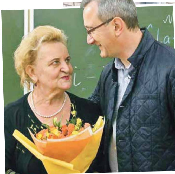
► Обнинцы заметили в демонтированном памятнике сходство с первой учительницей губернатора Шапши

— Создавался он сложно, это был трудоемкий процесс, — говорит Владимир Светлаков. — Выливать его из бронзы стоило бы очень