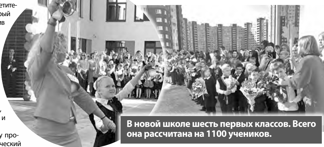
В новой школе шесть первых классов. Всего она рассчитана на 1100 учеников.