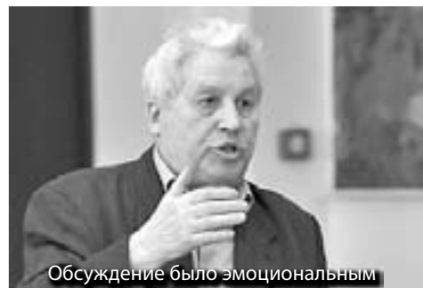
Обсуждение было эмоциональным

По его словам, причиной такого решения стал тот факт, что в большинстве своем в квартирах проживают семьи от трех человек. То есть им оплата услуги по обращению с ТКО выгодна именно из