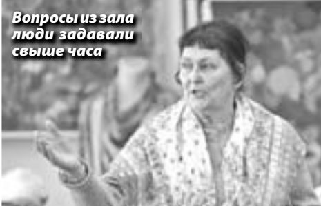
Вопросы из зала люди задавали свыше часа

расчета на квадратный метр жилплощади. Кроме того, это поспособствовало бы поддержке многодетных семей, коих в регионе достаточно много.