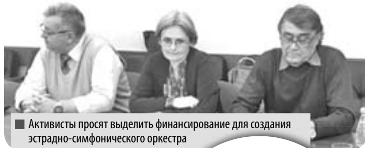
Активисты просят выделить финансирование для создания эстрадно-симфонического оркестра

В качестве второго примера она привела недавнее выступление в Москве. Там проходили