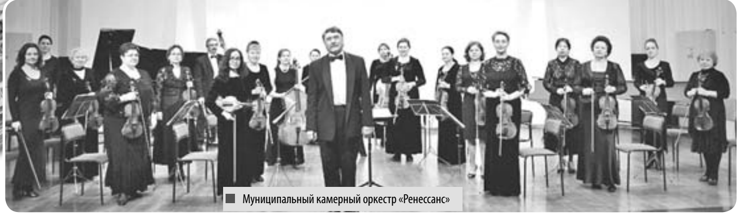
Муниципальный камерный оркестр «Ренессанс»

Интересное предложение на днях поступило в комитет по социальной политике Обнинского Городского Собрания. Инициативная группа граждан предложила создать в городе эстрадно-симфонический оркестр – идея, безусловно, интересная, только вот откуда на это взять деньги?..