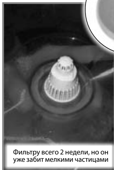
Фильтру всего 2 недели, но он уже забит мелкими частицами

Сейчас именно на эту спешку и пеняет хозяйка квартиры. Иначе как можно объяс-