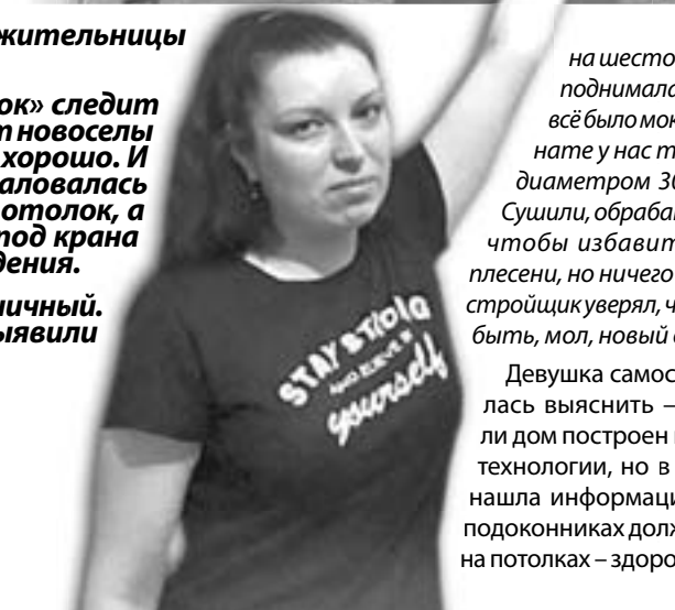
Плесень не щадит ничего...

– Видимо, во время стройки рядом с окнами проводили какие-то работы, и сейчас они усыпаны черными