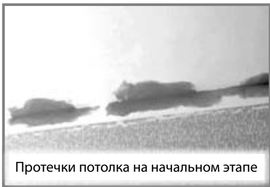
Протечки потолка на начальном этапе

пятнами – днем на улице смотреть невозможно, – говорит Юлия. – При этом застройщик говорит, что это не гарантийный случай. Мы связывались с компанией, которая предоставила застройщику окна, пришел сотрудник, посмотрел, сказал, что это не их вина, и они ничего менять не будут.