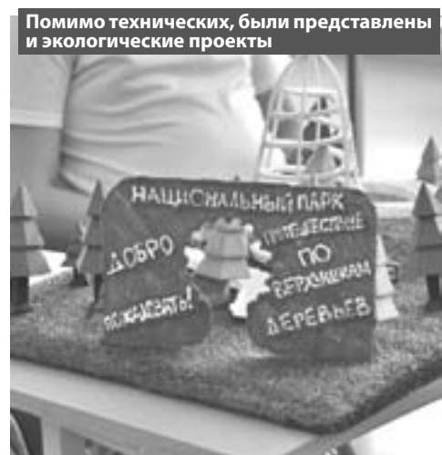
Помимо технических, были представлены и экологические проекты