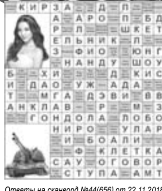
Ответы на сканворд №44(656) от 22.11.2018