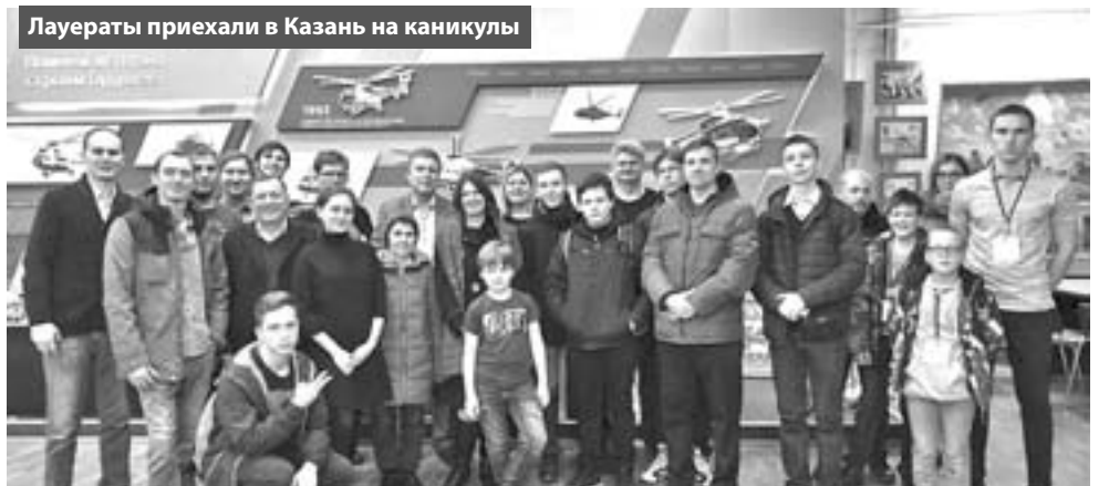
Лауреаты приехали в Казань на каникулы