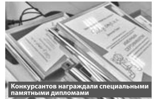
Конкурсантов награждали специальными памятным дипломами