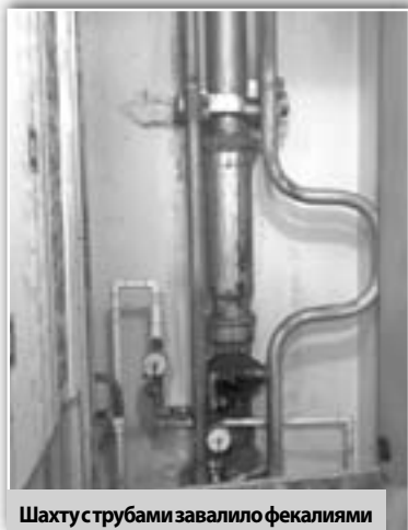
Шахту с трубами завалило фекалиями