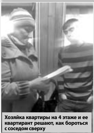
Хозяйка квартиры на 4 этаже и ее квартирант решают, как бороться с соседом сверху

Но зато есть другая огромная беда, с которой столкнулись жители. Так как мужчина годами не платил за коммуналку, у него скопился долг - 160 тысяч рублей. В связи с этим в квартире отрубили электричество. Потом отключили и воду, но не столько из-за долгов, сколько из-за