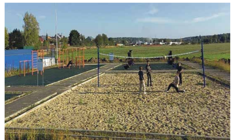
► В Кривском и в этом году не могут попрощаться со спортивной площадкой.

Что тут сказать, видеть из года в год одну и ту же зону в списках на голосование безусловно поднадоело. Но при этом каждый раз она