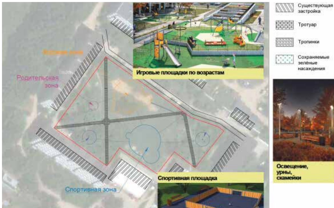
► Конкуренцию центральному парку в Ермолино составит зона отдыха на Советской.

но остается в аутсайдерах голосования, чуда не ожидается и в этом году.