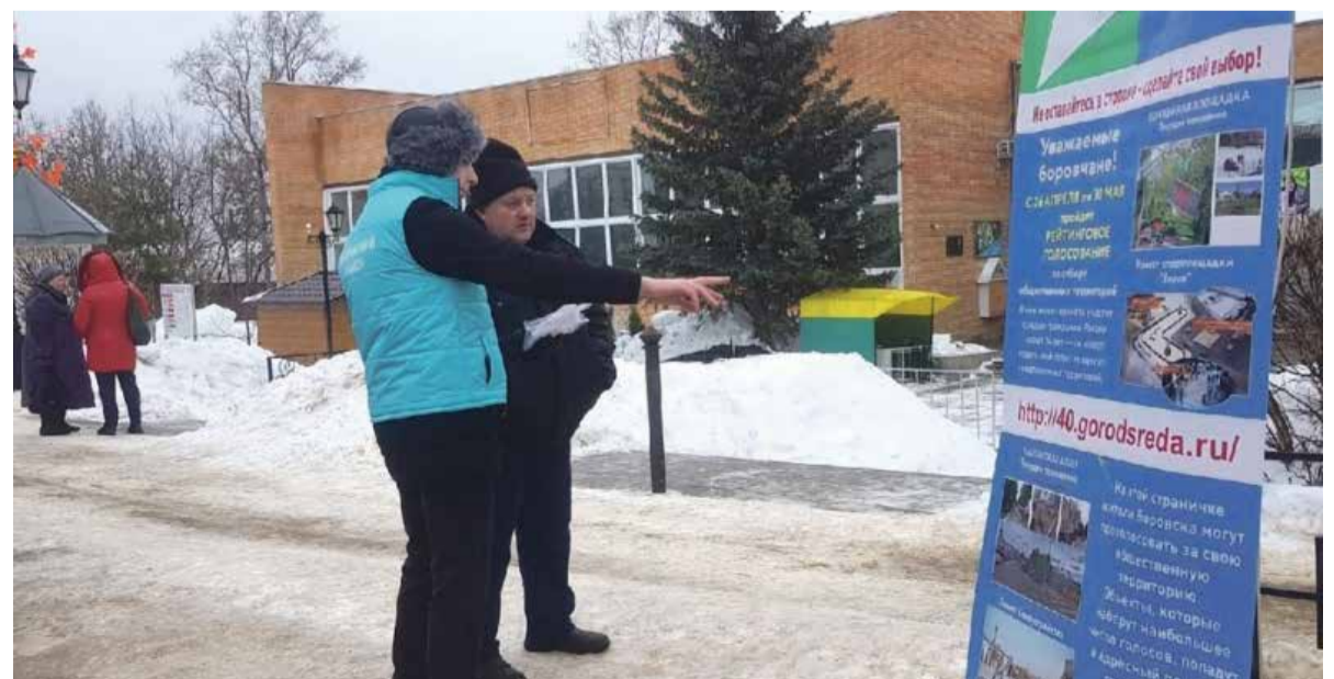
► Как и всегда, волонтеры готовы помочь жителям района сделать свой выбор.