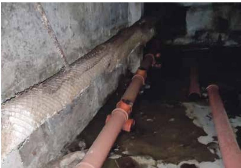
► Залитый стоками подвал дома №12А по улице Гагарина.

При этом также непонятным остаётся вопрос влияния района на процесс покупки. Если окажется, что мощность приобретаемой техники невысока, то может статься, что госпредприятие просто получит на баланс ещё одну машину, которой смогут пользоваться по своему усмотрению, а жители затопленных канализацией домов по-прежнему будут ждать приезда спецтехники из Калуги.