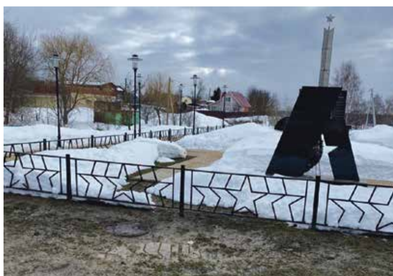
► Братскую могилу в Русиново пришлось спасать от канализационных вод.