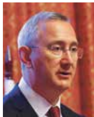
► Владислав Шапша

Не менее важная задача, которую ставит перед собой «Единая Россия» — исполнение наказов избирателей. На сайте er40.ru их более 1600. 1167 из них уже исполнены. И еще 350 наказов предстоит исполнить в 2023 году.