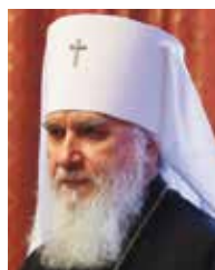
► Митрополит Климент

По словам митрополита Калужского и Боровского Климента, с самого начала проведения СВО Церковь активно помогает вынужденным переселенцам и военнослужащим. Для нужд фронта верующие изготавливают маскировочные сети, складные носилки, окопные свечи, собирают теплые вещи и предметы первой необходимости. Священники под-