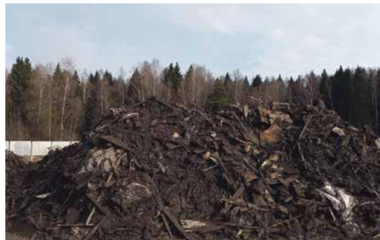
► 2023-й вскрыл всё, что зарыто.