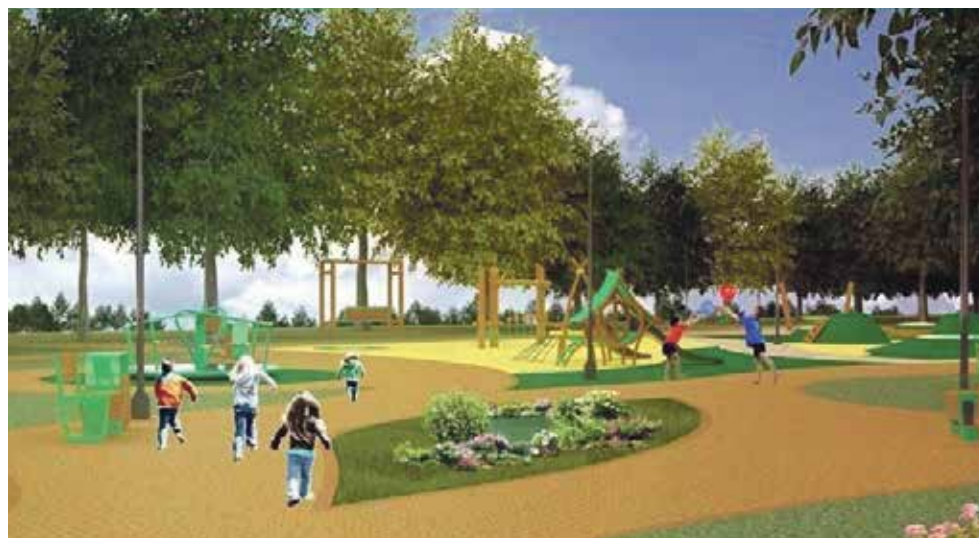
► Парк «Холмы и Липы» в Боровске

С этим проектом у города сложились очень интересные отношения. Идея превратить заросший пустырь в современную общественную зону для прогулок и досуга горожан пришлась по нраву всем. Проект поддерживают чиновники, депутаты, жители, но раз за разом он проигрывает другим оппонентам и уходит «в запас».