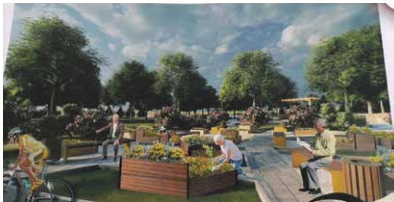
► На центральной площади Ермолино можно будет разбить свой сад