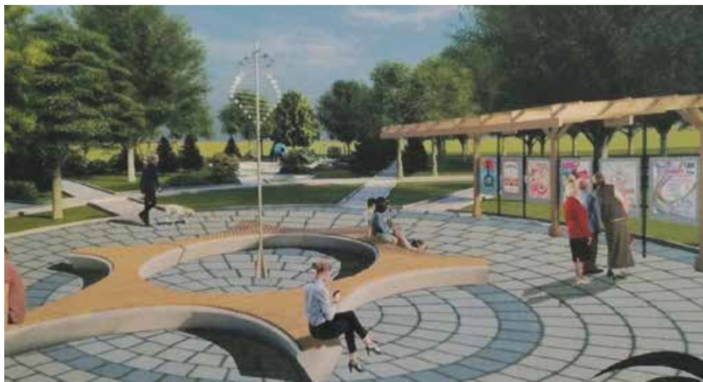
► Визуализация парковой зоны в Ермолино по ул. 1 Мая