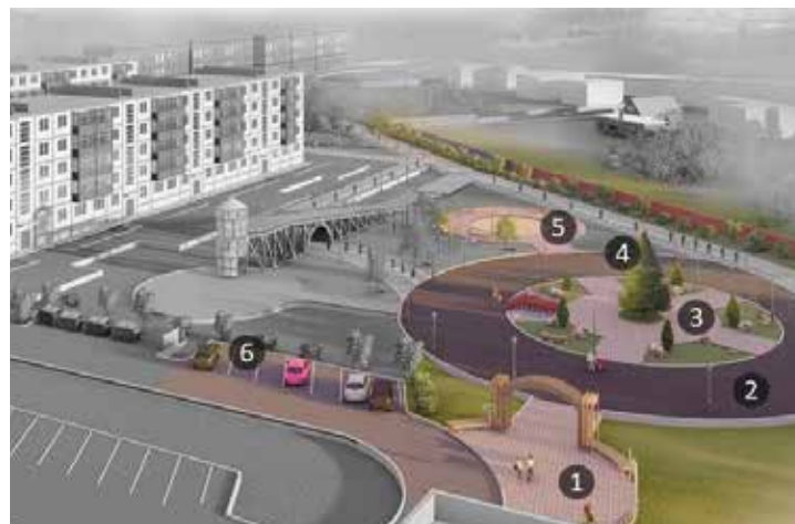
► Парк «Лесогорье» в Балабанове