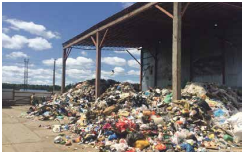
► В 2017-м кучи мусора выглядели так.