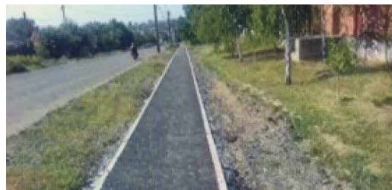
► Пешеходный тротуар в Совхозе Боровский в сторону Балабаново

Наиболее вероятным конкурентом «Холмам и липам» выглядит «Тропа здоровья». И говоря об этом варианте в первую очередь надо отметить, что он берет не исполнением, а сутью. Дело в том, что под этим названием скрывается участок от пешеходного моста через Протву к центральной районной больнице и остановке на улице 1 Мая протяженностью около 500 метров. В проект входит не только тротуар и обычные в таких случаях урны и лавочки, но и удобный подъем в горку, который без труда смогут осилить и пенсионеры. На сегодняшний день путь до больницы следовало бы назвать «тропой мужества», а не «здоровья». Поэтому горожане точно будут заинтересованы в этом проекте, независимо от его визуального вида — главное, чтобы было удобно.