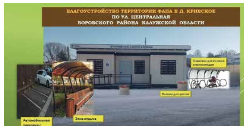
► Благоустройство территории вокруг ФАПа в деревне Кривское.