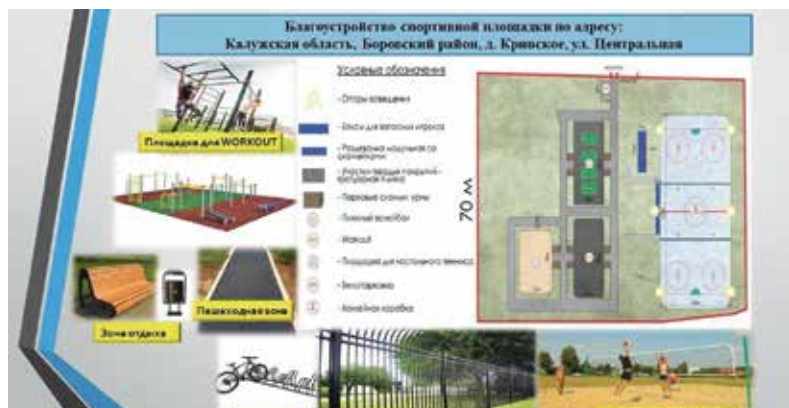
► Новый этап развития спортивной площадки в Кривском.

Судя по всему, администрация города решила «отыграться» за прошлый год, который в разрезе именно «Комфортной среды» получился очень спорным. Попавшая под реализацию площадка «Виразж» хоть в конечном итоге и была доведена до ума, получилась немножко не тем, на что рассчитывали жители. В этом году горожан должны порадовать благоустройством Текиженского оврага, и хотя сам проект выглядит многообещающим, да и стал победителем не только в «комфортном» голосовании, но и Всероссийском конкурсе малых городов,