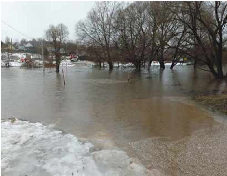
► Злополучный мост в деревне Аграфенино.

Еще одной жертвой паводка стал мост между деревнями Сатино и Дедюевка. Подвесную переправу между двумя этими населенными пунктами не просто затопило — ее регулярно атакуют плывущие по течению льдины. А потому пока сложно прогнозировать, будет ли она пригодна для использования после понижения уровня воды.