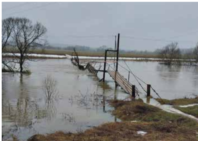
► Мост в Совхозе Боровский не пережил паводок