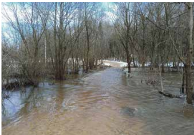
► Вода не смогла надолго отрезать деревню Павлово от района.