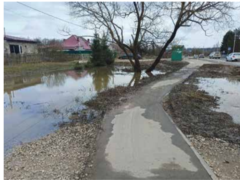
► Внезапный потоп в деревне Тимашово.