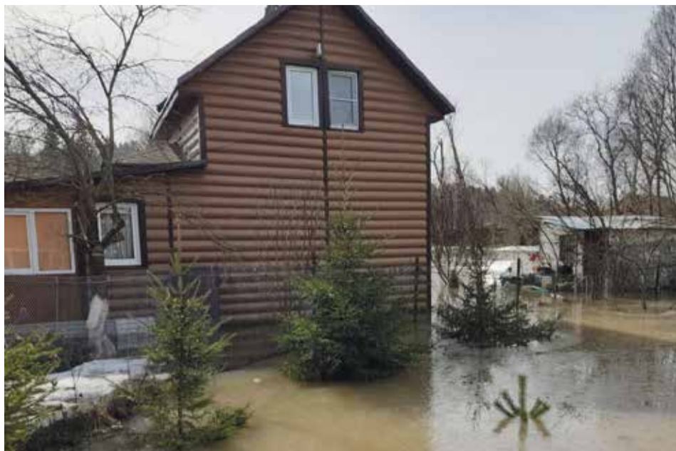
► В деревне Вашутино затопило несколько участков.