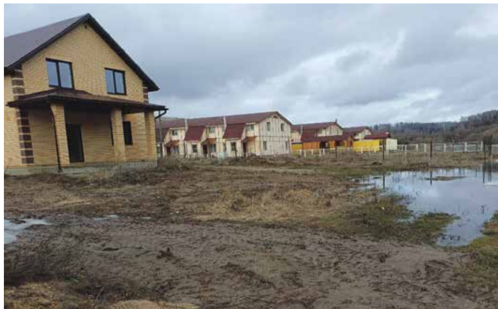
► До стройки на Текстильной в Ермолино вода не дошла