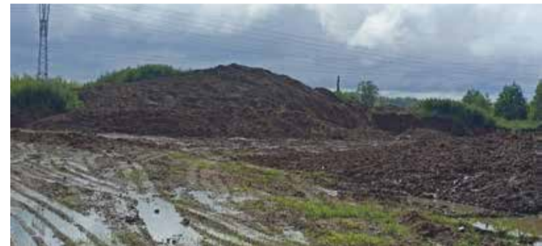
► «Подарок» от обнинского водоканала и правда можно почуять издали

— За время дежурства на объекте заметил «КАМАЗы» которые продолжают завозить строительный мусор. Но что куда больше настора-