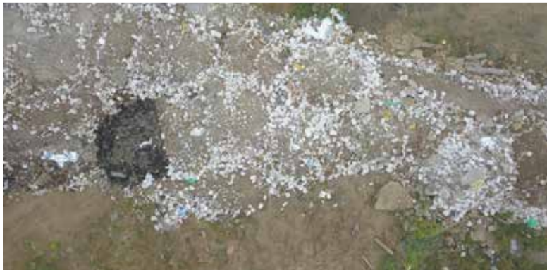
► С квадрокоптера картина выглядит куда удручающе

— Мы направили документы в полицию, прокуратуру, природоохранную прокуратуру, Минприроды,