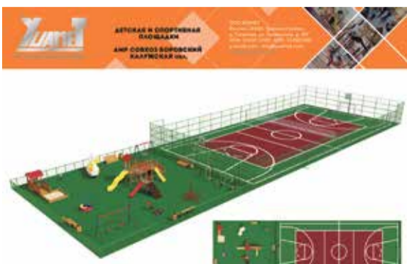
► В Совхозе «Боровоский» реализуют вторую часть начатого проекта

Судя по всему, жители приняли решение довести до конца уже начатые работы и поддержали именно эту задумку, пускай и с небольшим перевесом — 401 голос против 285. При этом наибольшую активность сельчане проявили в последний день голосования, когда с выбором определилось сразу 125 человек от общего числа.