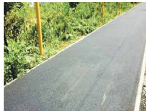
► Дорожка в ОПХ появится в Ермолине в следующем году