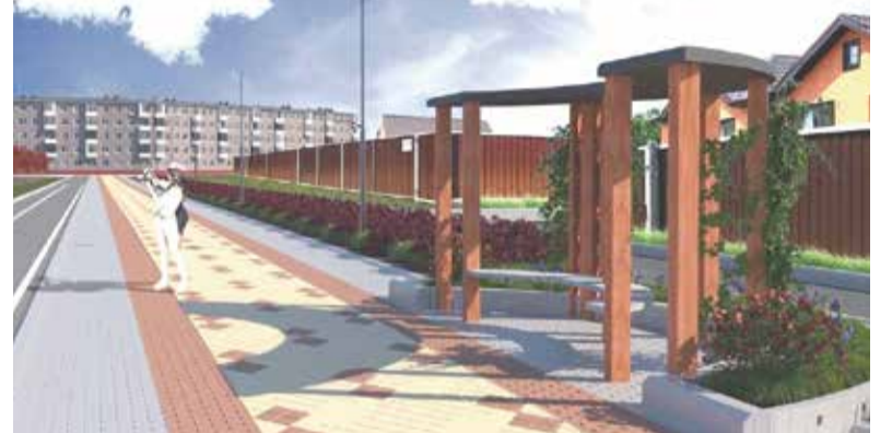
► В Балабанове дорожка на Кооперативной неожиданно «уделала» Лесогорье

Что же до результатов, то из 270 голосов 234 ушло в поддержку кат-