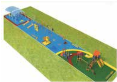
► Первое голосование в СП «Совьяки» выиграла детская площадка

«Лесогорье», который чиновники выставляют уже второй год подряд, и пешеходной дорожкой на улице Кооперативной.