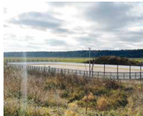
► В Кривском продолжают облагораживать каток

ка, благоустройством которой чиновники занимаются уже второй год подряд.