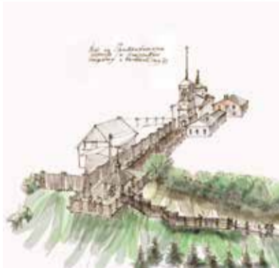
► В Боровске победителем стал источник «Текижа»

Но куда более интересными и неожиданными выглядят результаты голосования в Балабанове. В самом густонаселенном районе города жители выбирали между парком