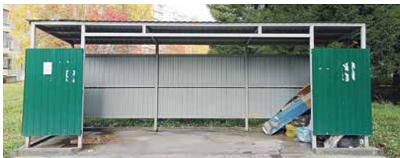
► Нижняя - Такую картину можно увидеть на выезде из районного центра.