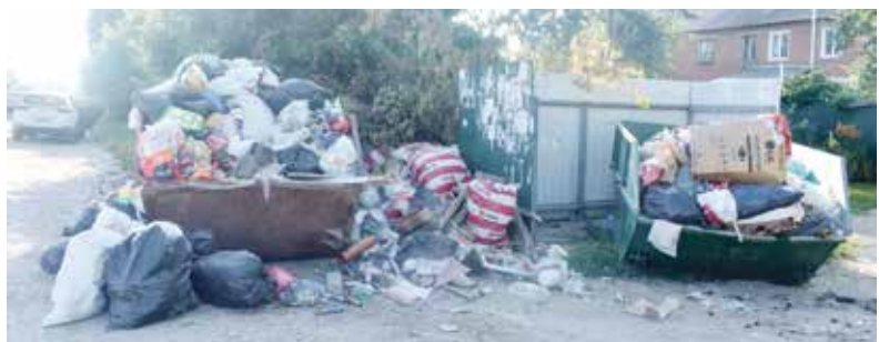
► Отдельные отсеки под крупногабарит помогут отделить его от ТБО.