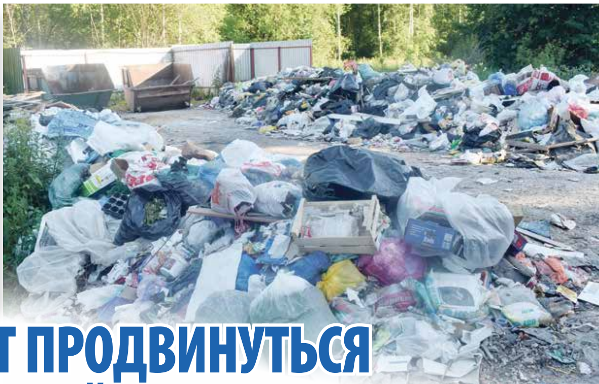
► Контейнерная площадка рядом с Деревеньками отаеся одной из самых проблемных точек района.

Более того, даже принятые решения, вроде создания на площадках отдельных зон для ТБО, так и остались по большей части не исполнены.