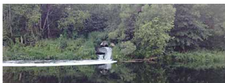
► На протяжении долгих лет ермолинские очистные сливали неочищенные стоки в реку, безбоязненно загрязняя главный боровский водоем.