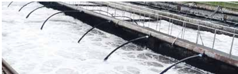
► В прошлом году на гидросооружении вы Ермолине началась глобальная реконструкция, которая, по официальным данным, должна закончиться в 2022 году. И это при том, что прокурора Боровского района ещё в 2019-м «выиграла» иск, по которому ГП «Калугаоблводоканал» должен был привести данный объект в порядок за шесть месяцев!