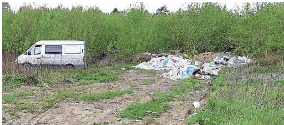
► Так выглядело то же самое место в мае прошлого года.