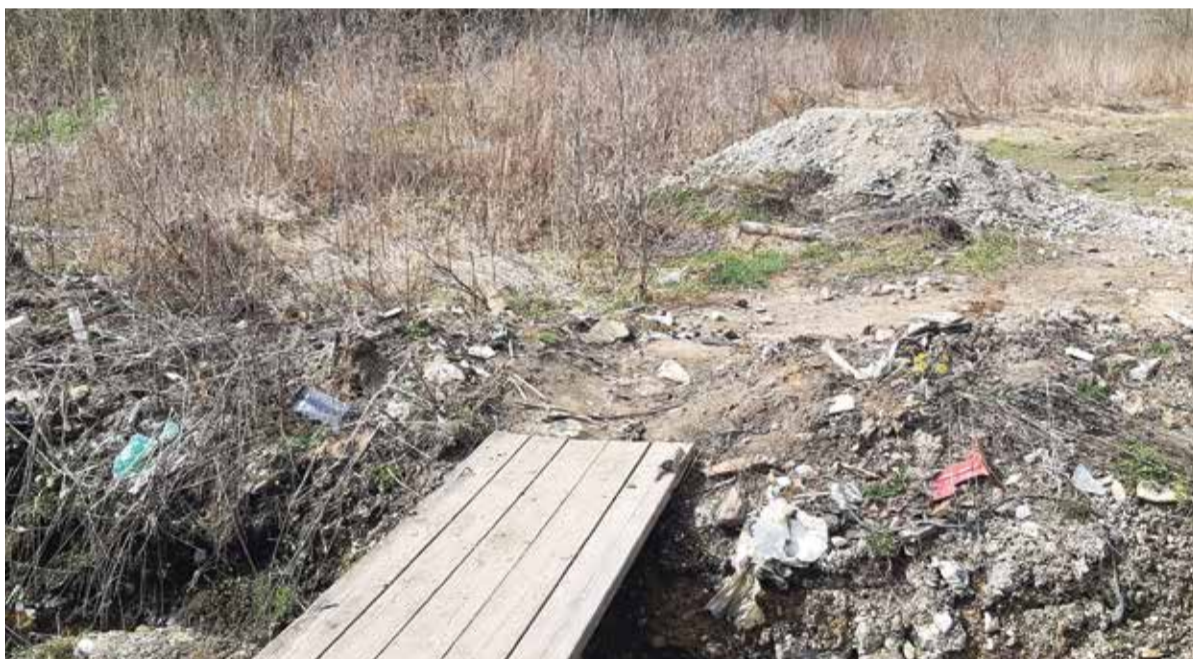
► Защитный ров не спас поселение от новой свалки.