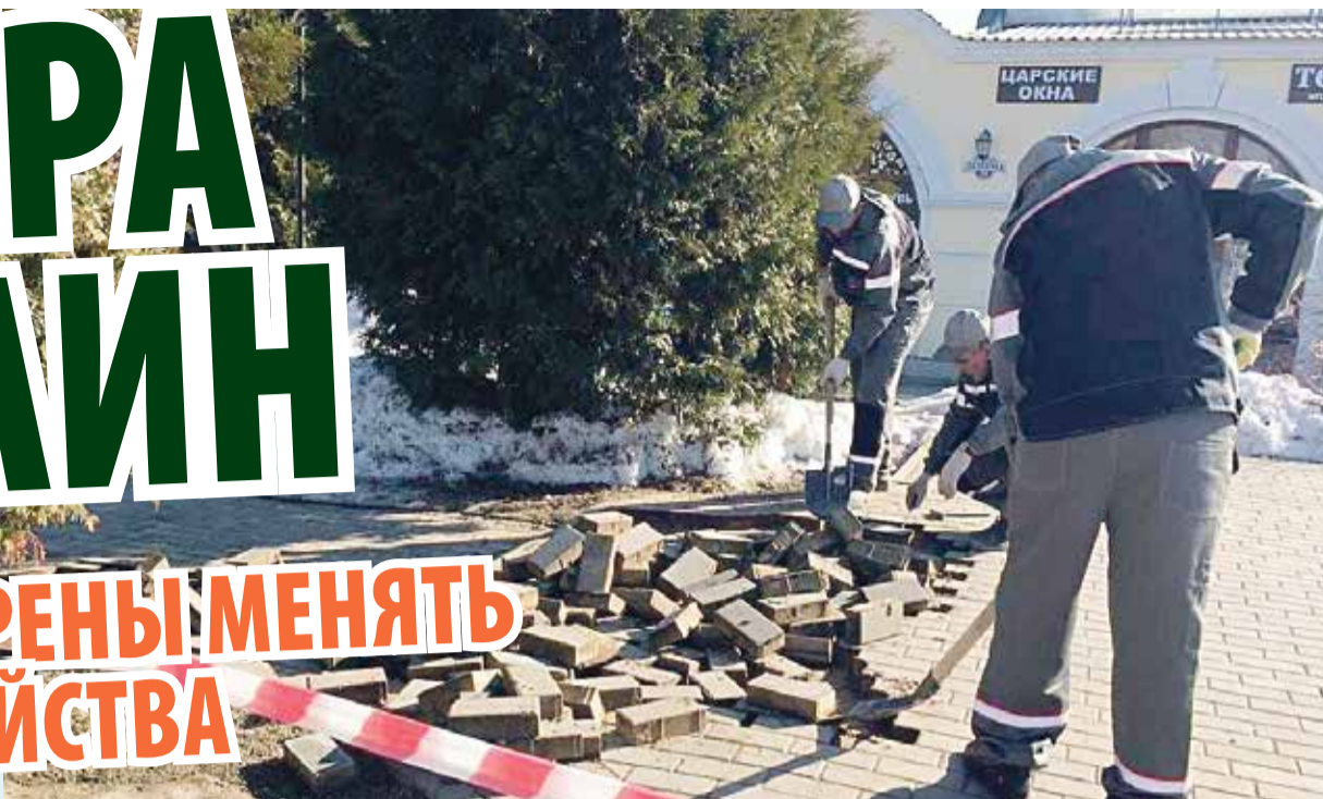
► Первый этап реконструкции площади Ленина затронет торговые ряды и коммуникации.

Нет ничего более наглядно констатирующего деятельность администраций, чем благоустройство населенных пунктов. Казалось бы, только этим направлением чиновники, как минимум, в Боровске и Балабанове, могли подтвердить свою заботу о гражданах и наличие хорошего слуха, поскольку согласно требованиям программы «Комфортная среда», выбор объекта благоустройства делают сами жители.