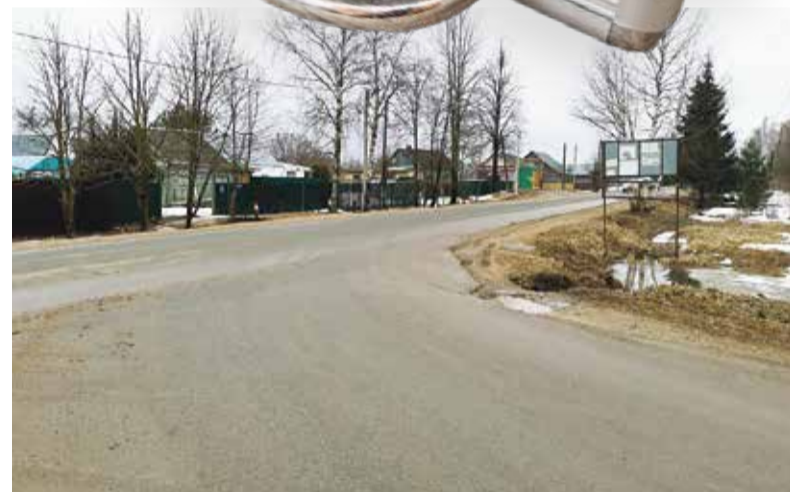
➤ Ремонтировать дороги в поселении готовятся уже в ближайшее время

Также по инициативе главы администрации поселения Ирины ЖИЛЬЦОВОЙ, было принято решение в этом году провести еще и газификацию здания, чтобы закончить