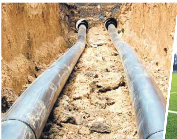
➤ Жители Коростелево получают водоснабжение...