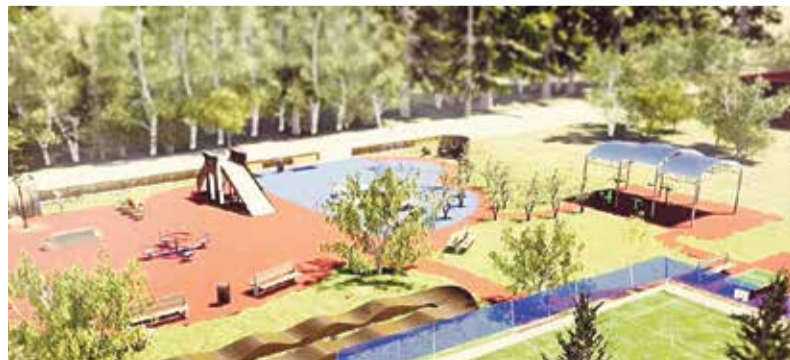
► Тематический парк «Нарния» подарит юным боровчанам новое путешествие в сказку.