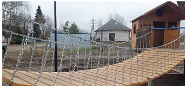
► Парк «Сказки Пушкина» стал одним из самых современных и необычных в районе.