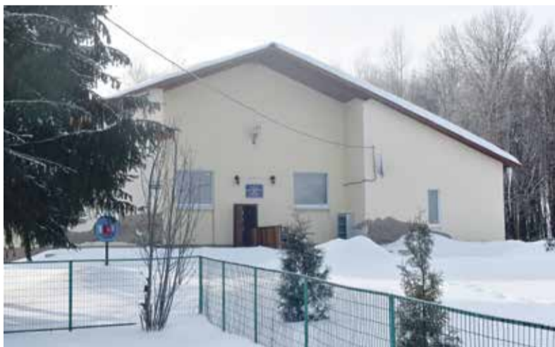
➤ В ДК Серединского в этом году вдохнут «новую жизнь».