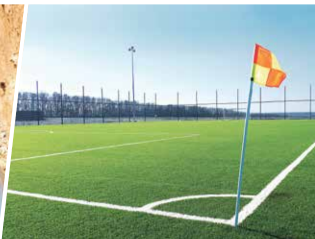
➤... и возможность сыграть в футбол на новом поле.