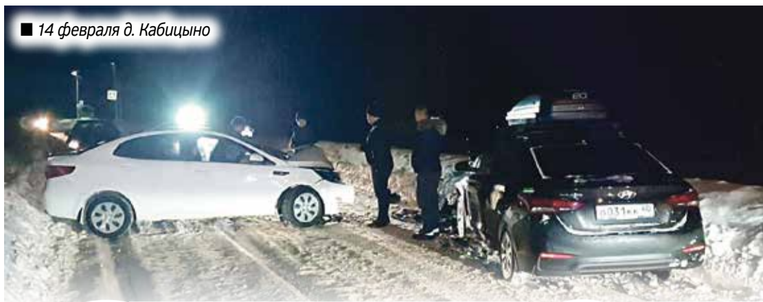
■ 14 февраля д. Кабицыно