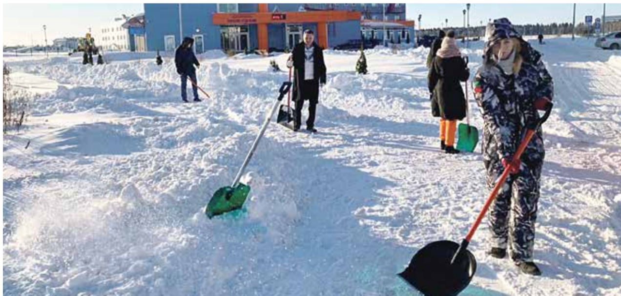
■ Дорогу к поликлинике чистят, кому надо «снежный десант» и «Динас-сервис»