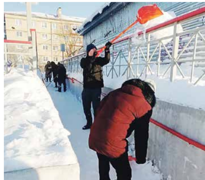
■ Пандус за РЖД тоже чистит «снежный десант»