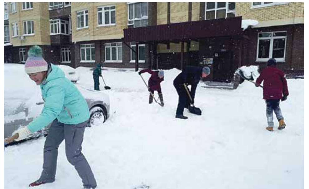
■ За машину и двор..