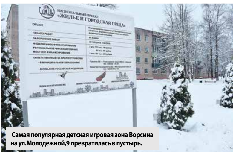
Самая популярная детская игровая зона Ворсина на ул. Молодежной, 9 превратилась в пустырь.