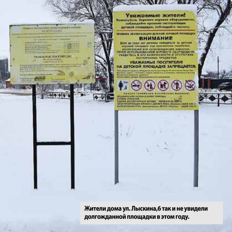
Жители дома ул. Лыскина, 6 так и не увидели долгожданной площадки в этом году.