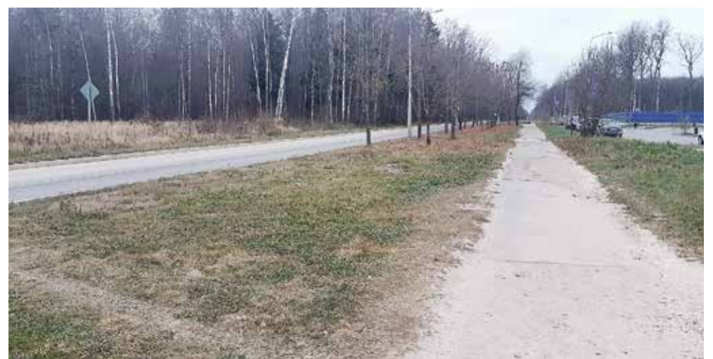
...а также немного дальше перекрестка, ближе к учебным корпусам ИАТЭ.