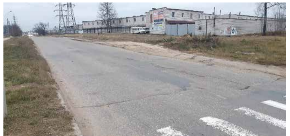
Разместить новые остановки планируют на участке между гаражами и "Технопарком"...