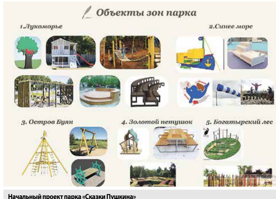
Начальный проект парка «Сказки Пушкина»