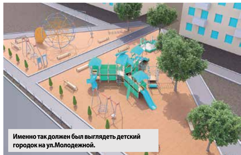
Именно так должен был выглядеть детский городок на ул. Молодежной.