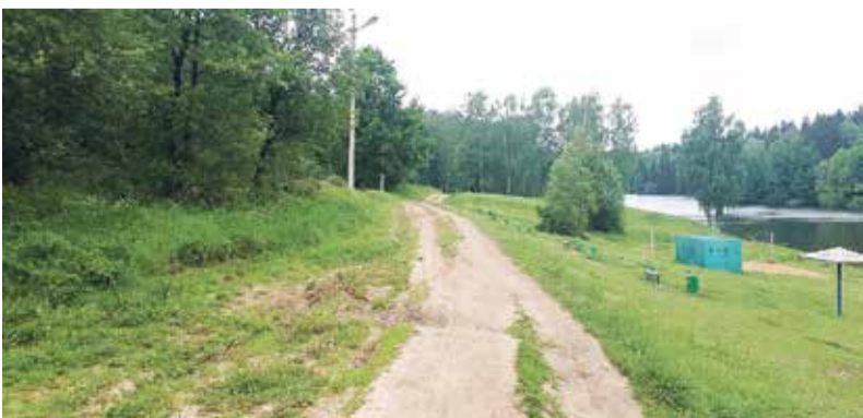
Вдоль дороги установят освещение и камеры наблюдения.