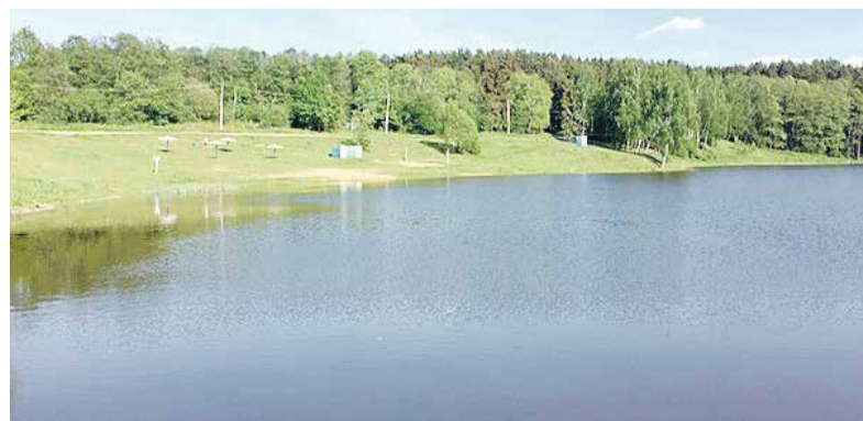
В 2021-м русло Страдаловки планируют очистить от иловых масс.