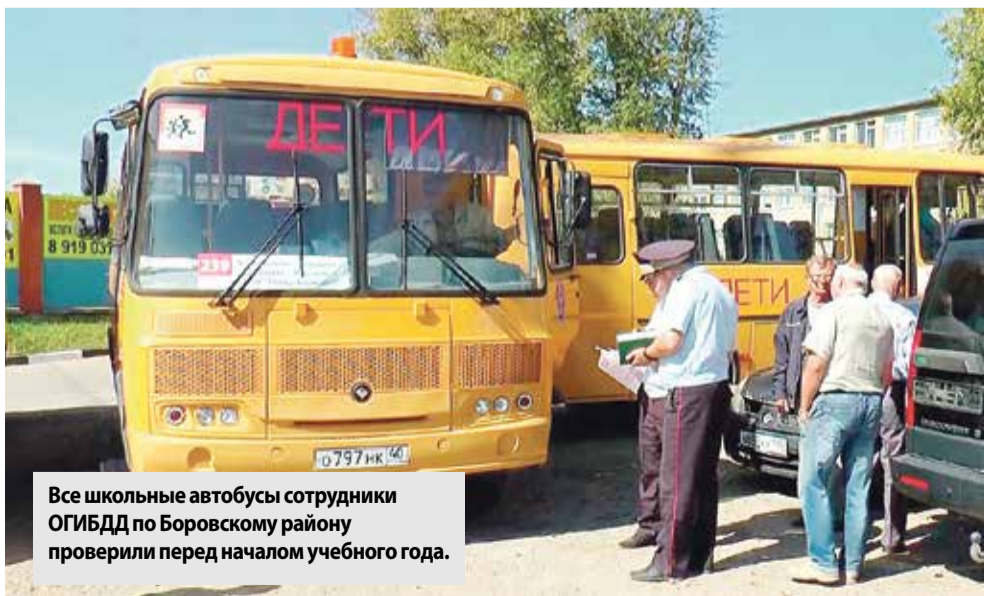
Все школьные автобусы сотрудники ОГИБДД по Боровскому району проверили перед началом учебного года.