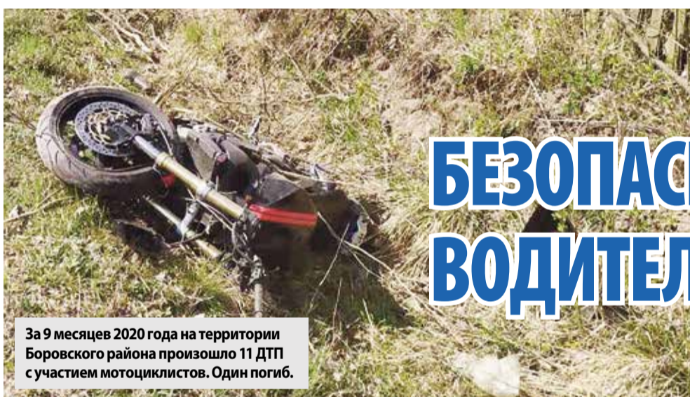
За 9 месяцев 2020 года на территории Боровского района произошло 11 ДТП с участием мотоциклистов. Один погиб.