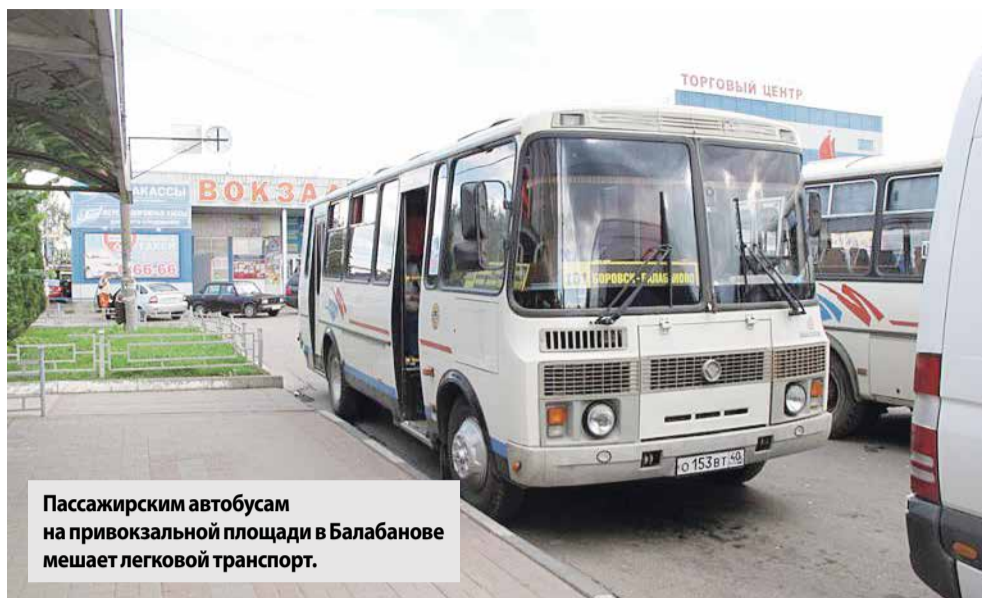
Пассажирским автобусам на привокзальной площади в Балабанове мешает легковой транспорт.

еще не меньше года, поскольку в этот завершающийся строительный сезон в городе пока не приступили к фактическому исполнению работ.