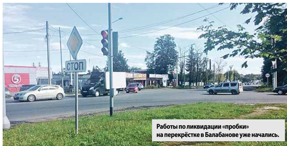
Работы по ликвидации «пробки» на перекрёстке в Балабанове уже начались.