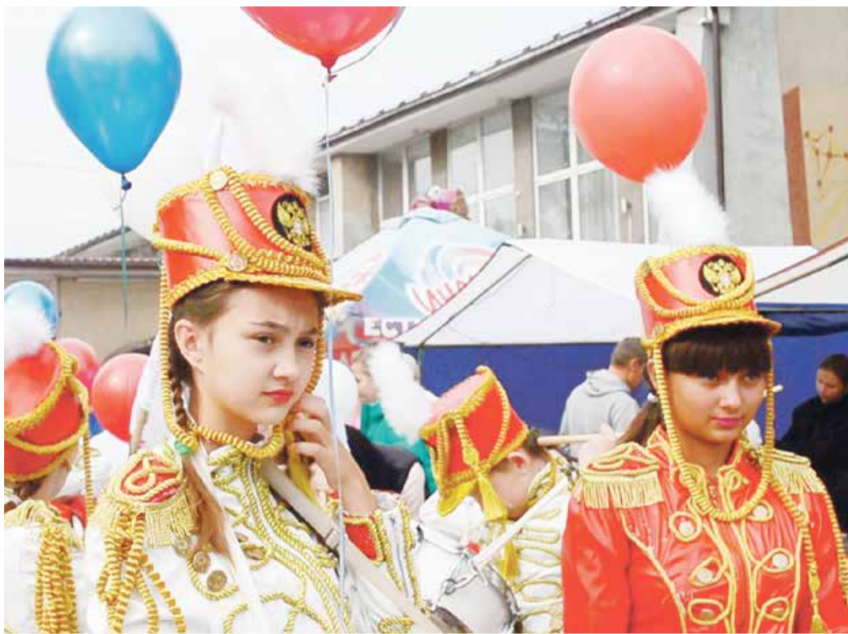
Выступление юных барабанщиц на Дне Села никого не оставило равнодушным.

шествие сделает круг по селу, с их приветствия и начинается праздничная часть.