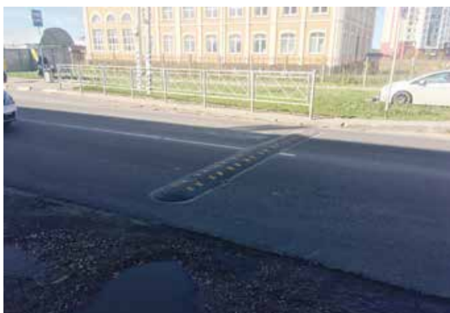
«Лежачие полицейские» сделают меньше, чтобы не тормозить трафик.