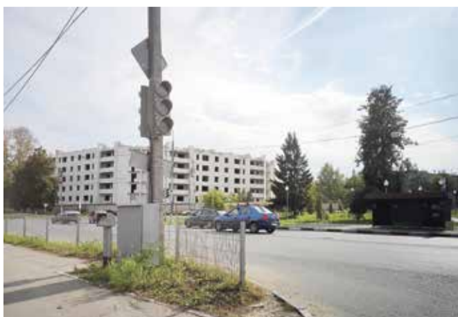
Регулировка светофора позволит увеличить пропускную способность.