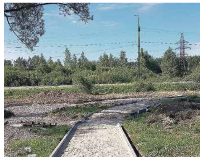
Работа над парком «Сказки Пушкина» продолжается.