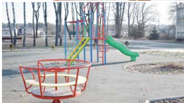
В деревне Асеньевское появился современный семейный парк.

— А в целом, на Ваш взгляд, сама концепция жизни в селе с городским комфортом осуществима?