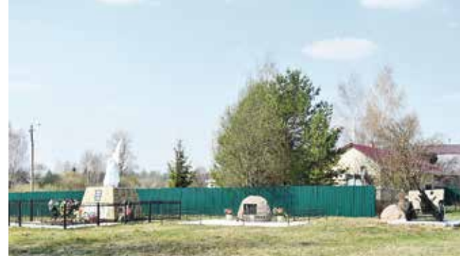
Мемориальный комплекс в деревне Федорино должен преобразиться в ближайшие годы.