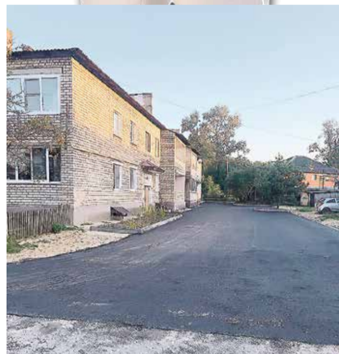
Шесть придомовых территорий были обновлены по программе «Комфортная среда».