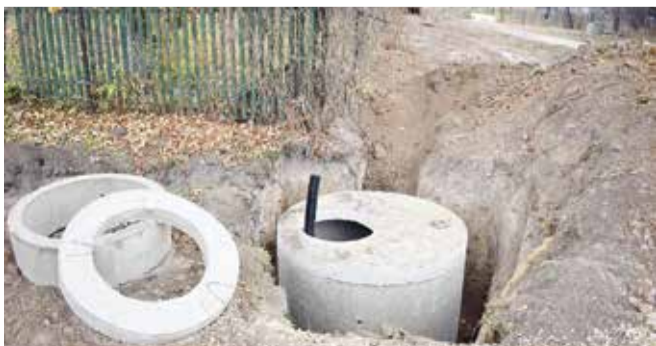
На участке Абрамовское-Хитрово-Щиглево было заменено 5,5 километров труб.