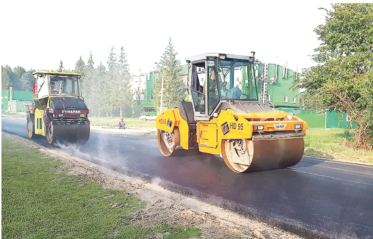
Завершено асфальтирование улицы Московской.