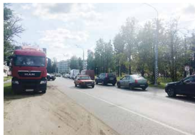
Вереницы машин собираются на перекрестке каждый день.