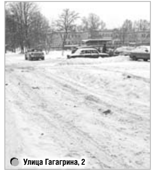
Улица Гагарина, 2

Например, жители дома № 6 по улице Фабричной даже не могут вспомнить неделю, когда у них во дворе появлялся трактор. Дополняет картину сиротливо торчащие из-под белого покрова спинки лавочек да верхушки детских игровых конструкций. Подобный пейзаж больше бы подошел какому-нибудь постапокалиптическому роману, ведь двор выглядит не просто неухоженным, а именно брошенным и будто бы нежилым. К тому же подобное наплевательство со стороны ответственных лиц может обернуться серьезными проблемами в будущем.