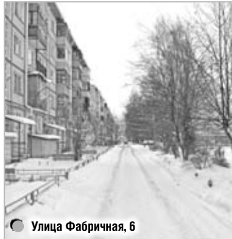
Улица Фабричная, 6

Кроме того, в Ермолине уже были случаи, когда бездействие коммунальщиков становилось причиной трагедии. Достаточно вспомнить случай, когда несколько лет назад упавшая с крыши дома № 6 по улице Ленина сосулька убила маленькую девочку.