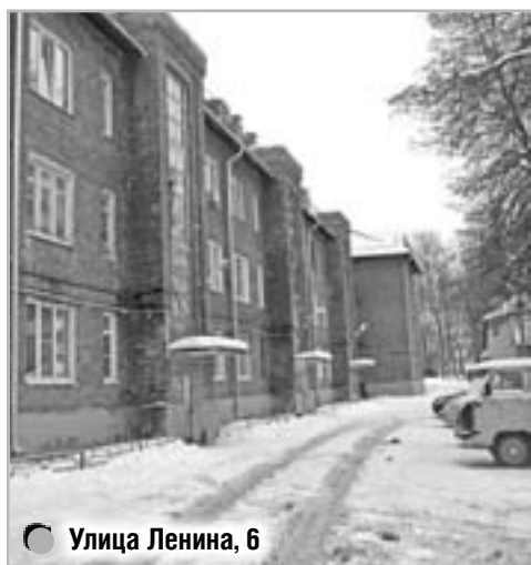
Улица Ленина, 6