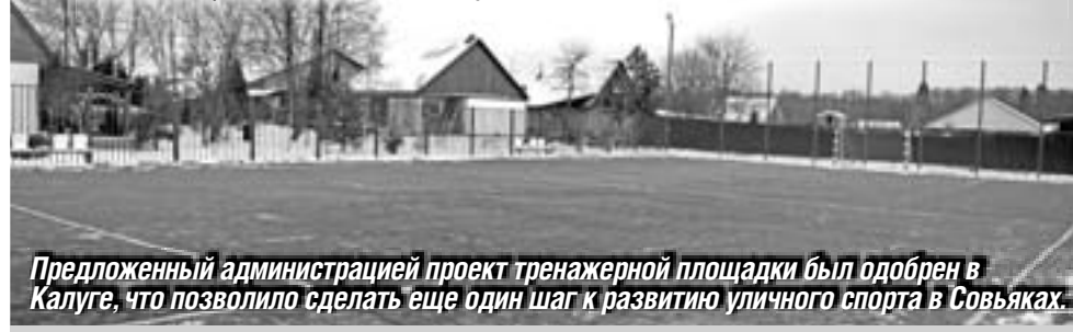
Предложенный администрацией проект тренажерной площадки был одобрен в Калуге, что позволило сделать еще один шаг к развитию уличного спорта в Совьяках.

В этом году благодаря полученному гранту на развитие сельского поселения в Кривском был построен новый футбольный стадион. Глядя на удачный опыт соседей, в Совьяках решили не отставать и тоже запланировали строительство новой спортивной зоны на следующий год.