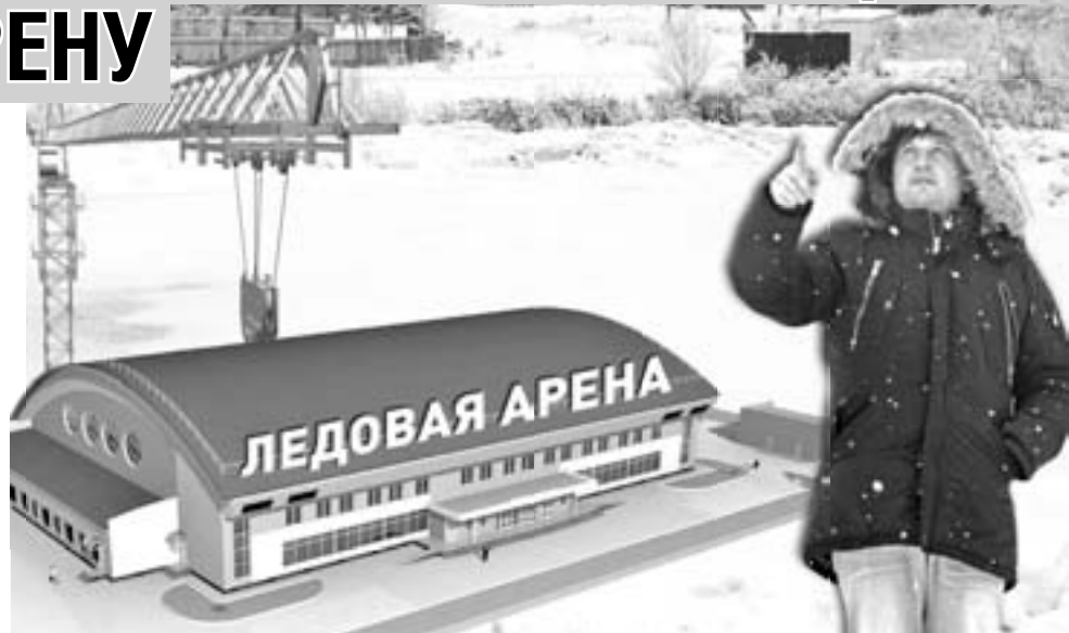
Но ограничиваться одним лишь ледовым полем администрация не намерена и планирует в будущем году активно взяться за его дальнейшее развитие.

Причиной тому послужили сразу два фактора. Первым, как ни странно, стало строительство нового стадиона. Получив площадку для летних игр, чиновники задумались над тем, что ее использование для создания катка может плохо сказаться на качестве футбольного покрытия, и стали искать альтернативу. Выбор пал на небольшой пустырь между улицами Центральной