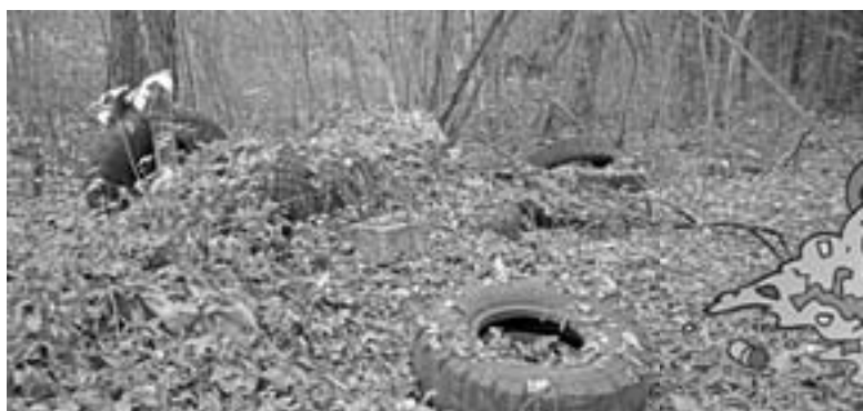
Например в СНТ «Лесное» дачники уже долгое время бьют тревогу из-за обилия ТБО на прилегающих территориях, но до их бед никому нет дела.

- Конечно это и наша вина, всегда находятся те, кто плюет на окружающих и делает так, как ему хочется, но мы уже не первый год