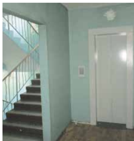
■ Подъезд одного из домов, которые обслуживает УК Обнинск

По такой схеме УК «Обнинск» работала и в прошлом году, поэтому особых проблем в домах, которые она обслуживает, этой зимой не было.