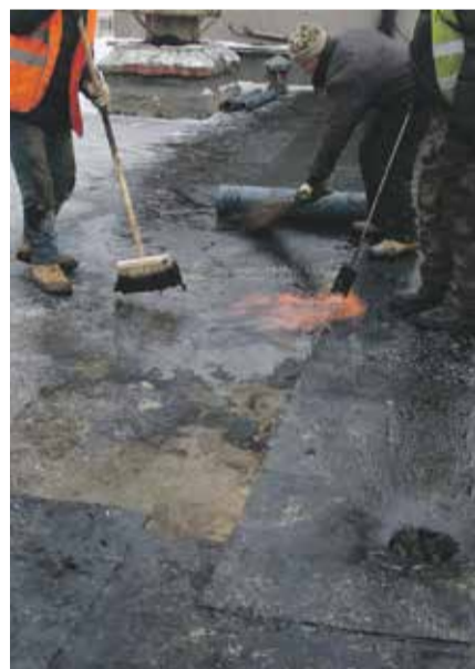
■ Ремонт крыш УК Обнинск не станет откладывать в долгий ящик

Евгений Вячеславович пояснил, что в перечень работ по подготовке к отопительному сезону входит не только ремонт систем отопления, водоснабжения и канализации, но и приведение в надлежащий вид крыш. Какие-то из них