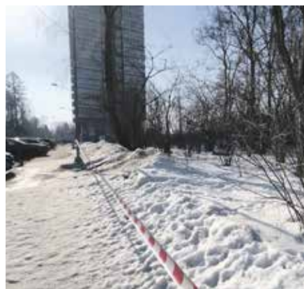
■ Рядом со строительной площадкой расположен другой жилой дом — построенный в 2017 году