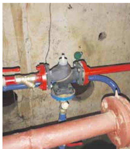
■ ТРЖ, регулирующие температуру горячей воды, в некоторых домах придётся менять или ремонтировать

Конечно, УК выполняет все работы в рамках финансовых возможностей каждого дома. А тариф в домах этой компании не индексировался с 2017 года. При том, что стоимость материалов и услуг за 7 лет повышалась