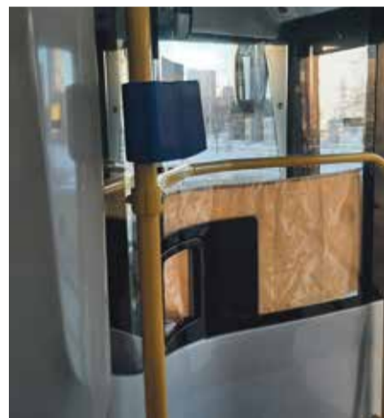
■ При входе в автобус можно оплатить лично водителю, а можно через валидатор