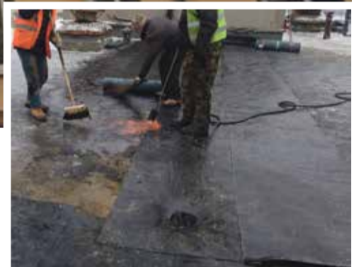
■ Прохудившаяся крыша требует капитального ремонта