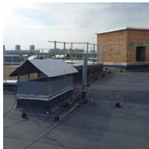
■ Благодаря УК Обнинск в 12 домах был проведен капремонт. В том числе отремонтировали и кровли