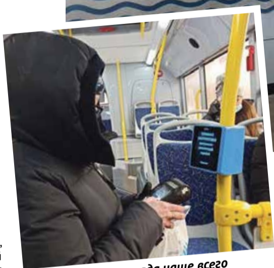
■ Жители наукограда чаще всего пользуются валидаторами