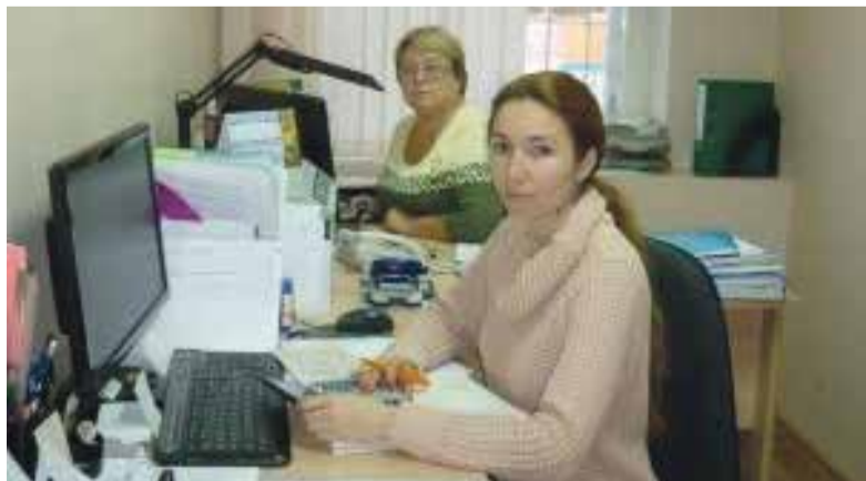
■ Специалисты центра социального обслуживания пожилых граждан и инвалидов

Следует уточнить, что бесплатно этим гражданам оказываются только услуги соцработника, а за приобретенные продукты, лекарства и прочее они обязаны платить сами.