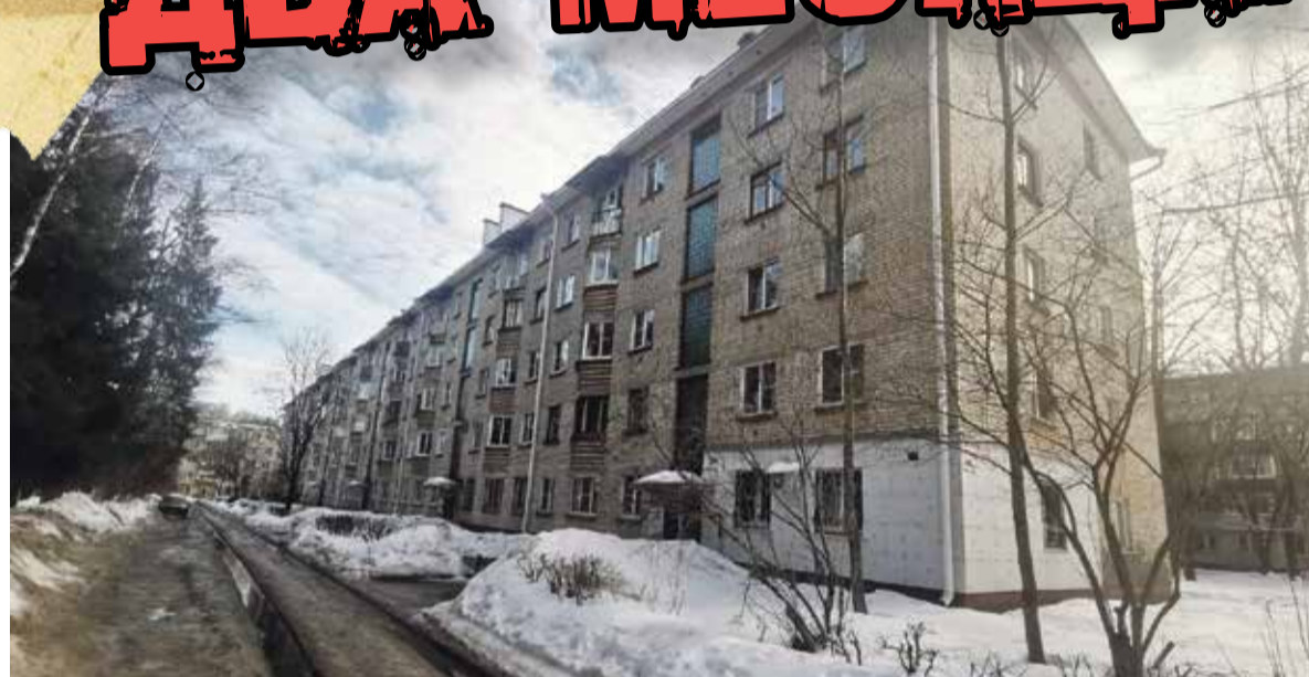
■ В этом доме нашли труп одинокой старушки

Несмотря на то, что пенсионерка отказалась от услуг соцработника, Центр социального обслуживания граждан пожилого возраста и инвалидов, а также отдел опеки и попечительства города взяли ее на со-