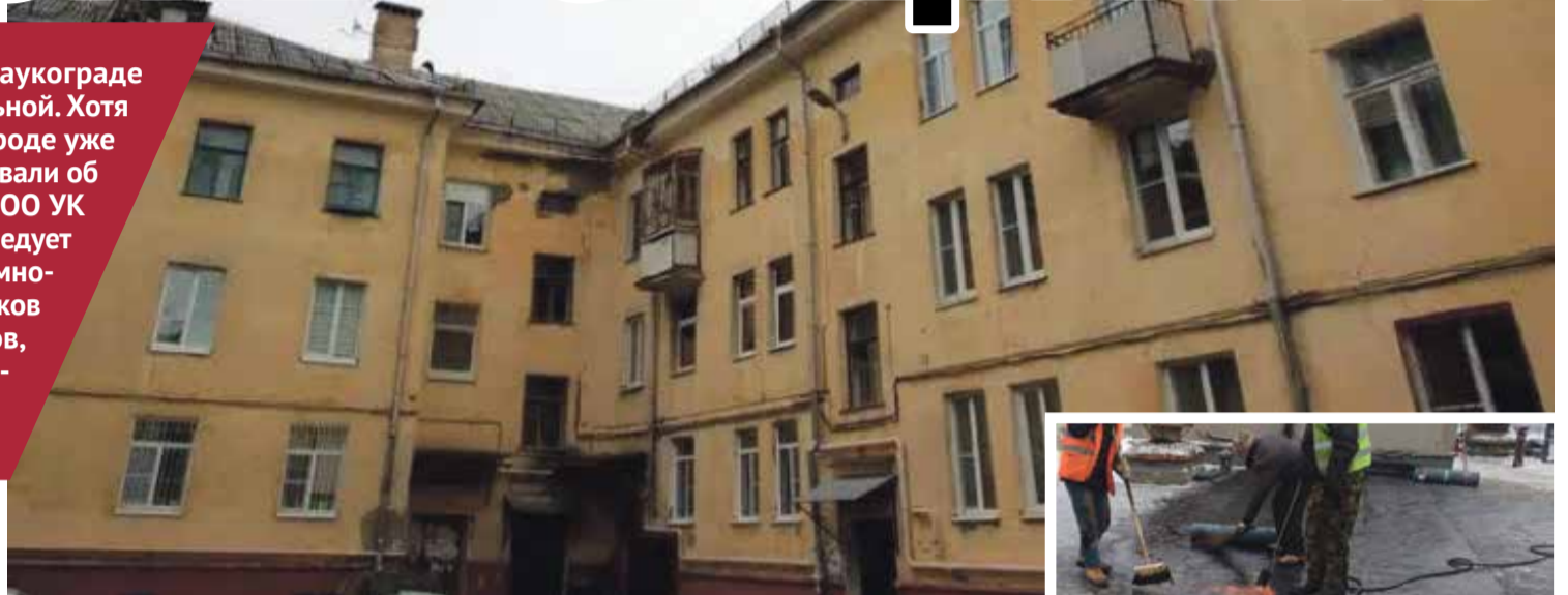
■ Дом 22/8 на проспекте Ленина