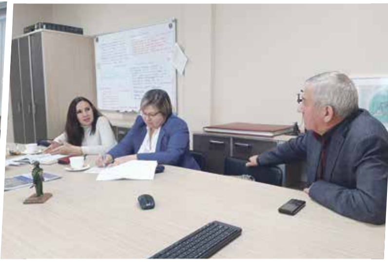
■ Представители городской Управы Калуги рассказывали о том, как построена работа аварийных служб в областном центре