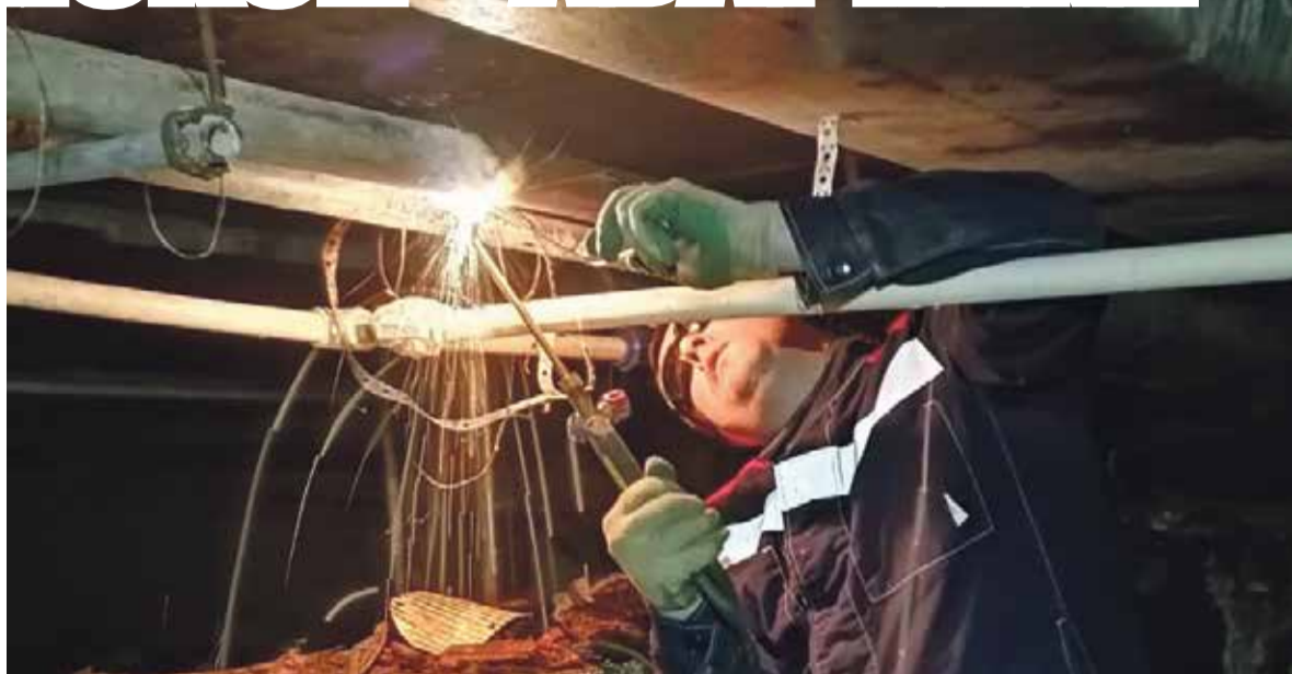
■ Работа электрика - дело тонкое