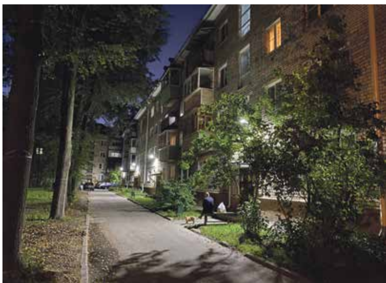
■ Фонари рядом с домом 9 на улице Победы

— И сигнал получаем очень быстро, и аварию устранять начинаем сразу же. Многие жители Обнинска знают телефон нашей оперативно-диспетчерской службы (39-6-18-84) и в случае нарушения электроснабжения сообщают о проблеме. Кроме того, у нас на предприятии функционирует еще и система телемеханики по центрам питания, которая отслеживает и фиксирует отключения электричества на крупных магистралях. Диспетчер видит поломку сразу же, еще до того, как о ней начинают сообщать по телефону жители города. И тут же на место направляют специалистов-электриков.