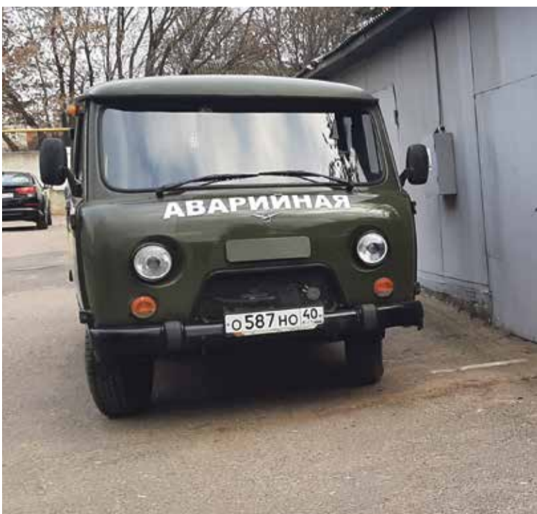
■ Спецтехника аварийной службы

Такое взаимодействие, без сомнения, пойдет на пользу обеим сторонам.