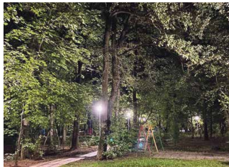
■ Светильники на Победы, 9 (3)