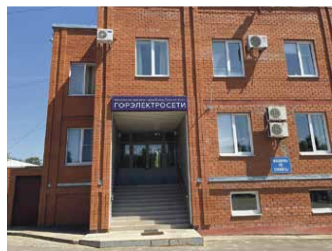
■ Офис МП Горэлектросети

— А как Вы оцениваете активность наших граждан в этом вопросе?