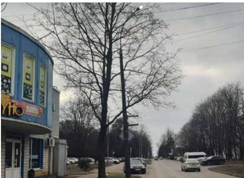
■ Светильник включили днем, чтобы проверить его работу

Кроме того, в Обнинске работает программа, по которой собственники помещений в многоквартирных жилых домах могут подать заявку на установку светильников на фасаде своего дома, тем самым улучшив внутриворонное освещение.