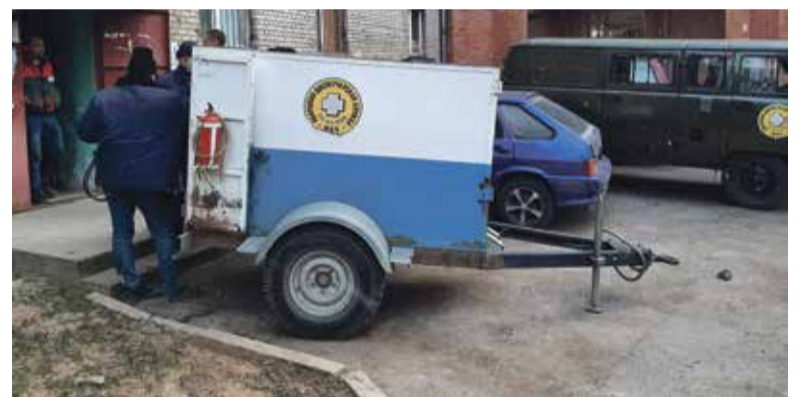
■ Работники аварийной службы прибыли на место аварии

У аварийной службы не бывает спокойного периода работы. Зимой и осенью, понятное дело, много проблем с отоплением. Казалось бы, закончился отопительный сезон и количество заявок должно сократиться. Но не тут-то было... Их по-прежнему много — в этот период в АДС поступают многочисленные