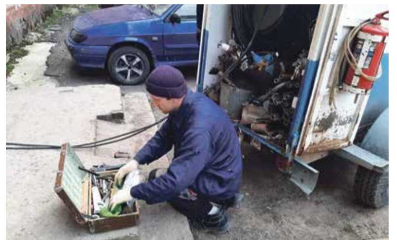
■ Сварочный пост АДС задействован ежедневно

нарекания на работу полотенцесушителей и низкую температуру горячей воды. Так что покой работникам этого подразделения МП «УЖКХ» только снится.