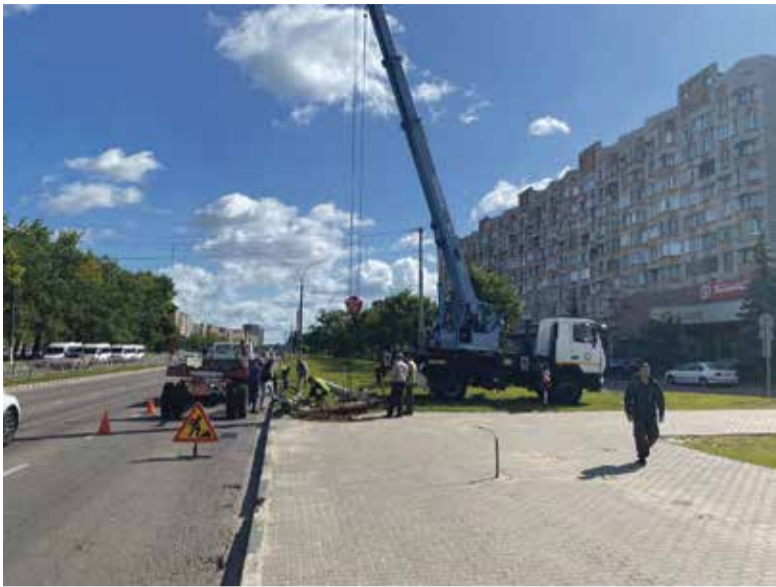
■ Работы по восстановлению поврежденной в ходе ДТП опоры освещения на проспекте Маркса

— Но жители обращаются в «Горэлектросети» не только когда темно, но и когда светильники горят среди бела дня. Почему такое происходит?