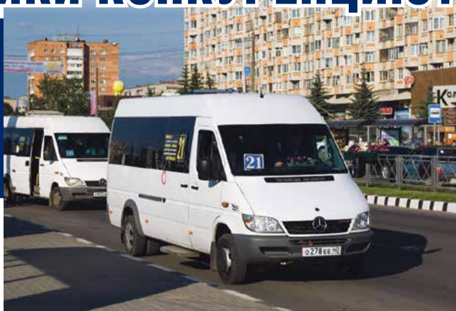
■ Жители часто жалуются на работу маршрутных такси

Тюленев, людям пришлось работать без обеда и без передышек. Тяжеловато пришлось, но справились.