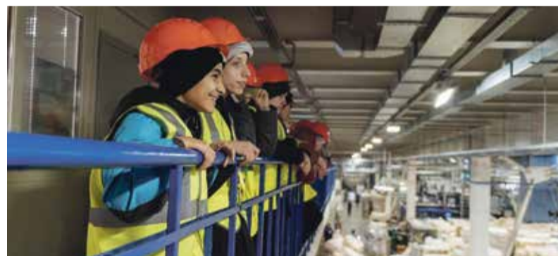
■ Ученики с интересом слушали о тонкостях работы специалистов компании и том, как производится продукция