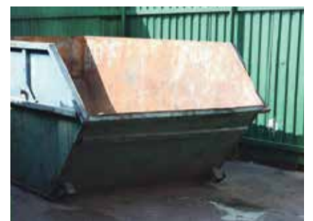
■ Так выглядит бункер для крупногабаритного мусора

Пока все эти места временные, их определили до весны. А с наступлением тепла будут организованы уже постоянные площадки с объемными баками.