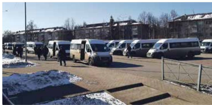
■ Водителей-частников ждут сложные времена

В который раз констатируем, что власти Обнинска в свое время приняли мудрое решение, когда сохранили в городе муниципальное автотранспортное предприятие. Этим не может похвастаться, к примеру, тот же Малоярославецкий район, да и другие. Там муниципальное АТП ликвидировали в связи с его нерентабельностью. Ни о какой помощи речи даже не шло. В наукограде пошли другим путем. И в настоящее время МП ОПАТП хотят не просто сохранить, но и модернизировать. В этом году вместе с новыми автобусами предприятие получило статус сервисного центра, и теперь его специалисты осуществляют ремонт транспорта на новых условиях.