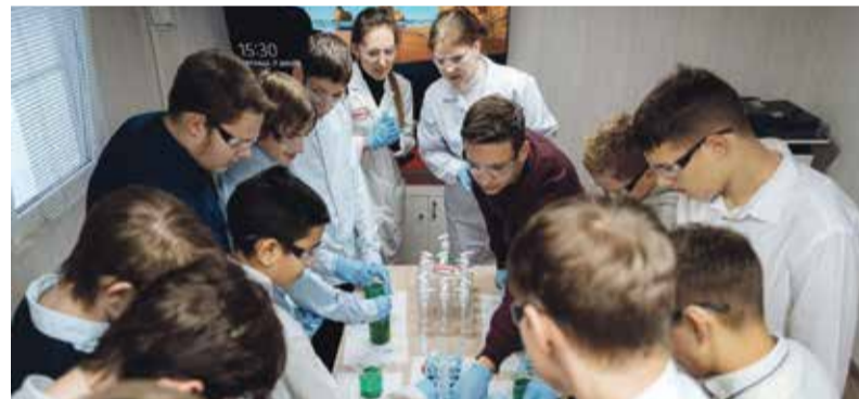
■ Школьники смогли попробовать себя в роли настоящих химиков-технологов