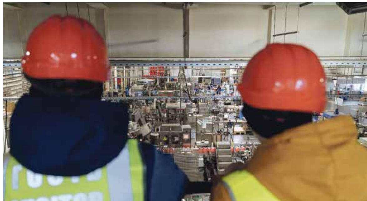
■ Огромное производство вызвало у ребят искренний восторг