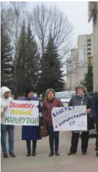
■ В 2015 году в ответ на забастовку водителей жители организовали пикет