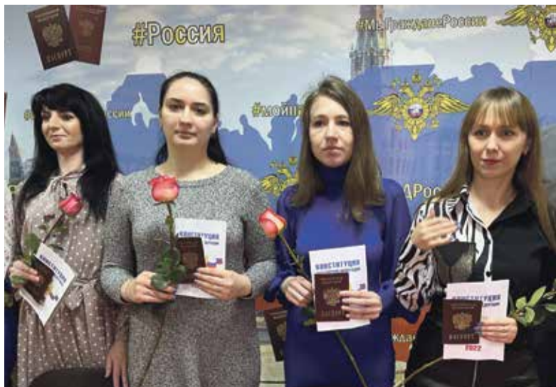
■ Получать паспорт в торжественной обстановке очень приятно и почётно.

В свою очередь, граждане, получившие паспорта и буклеты Конституции Российской Федерации в подарок, искренне благодарили организаторов мероприятия за теплую встречу и радушный прием и пообещали соблюдать закон и порядок, и что самое главное — бережно хранить свой паспорт гражданина Российской Федерации.