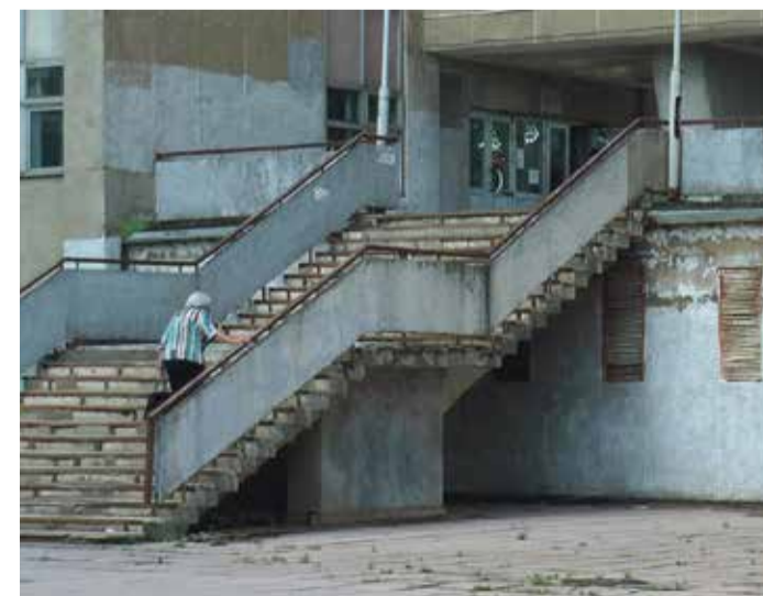
■ Лестницу обязательно отремонтируют, но позже