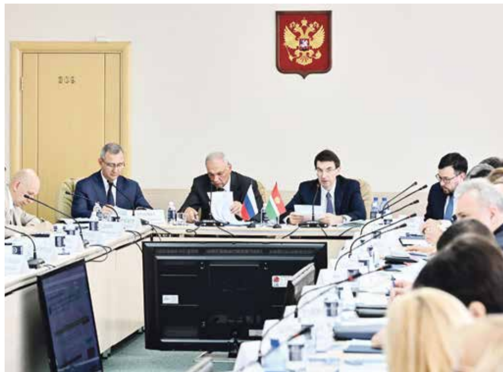
■ В Обнинске обсудили перспективы реализации государственной национальной политики в субъектах ЦФО. (Обнинск, Июль, 2022 г.)

Понятно, что все вышеперечисленное не означает массовой зачистки области от иностранных граждан, приехавших на заработки. Дешевая рабочая сила востребована на предприятиях, и так просто от нее никто не откажется. В настоящее время на территории Калужской области остается (только официально) не менее 54 тыс. мигрантов. Точнее, иностранных граждан и лиц без гражданства.