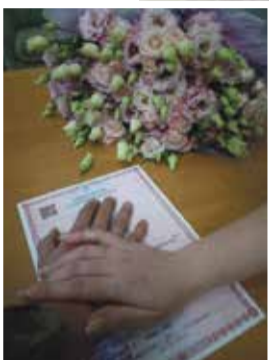
■ Молодые обменялись кольцами