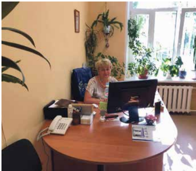
■ Отдел опеки