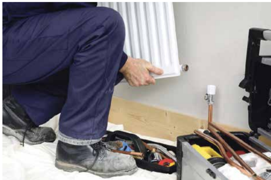
■ Нередко жители Обнинска самостоятельно меняют батареи и создают проблемы аварийной службе

Здесь логика сантехников АДС вполне понятна. Как они говорят, уж лучше сделаем мы, чем сами жильцы, которые допустят ошибки, а исправлять их потом все равно придется нам.