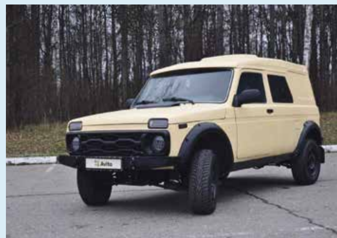
■ Тот самый бронемобиль

— Я купил спецавтомобиль — большую инкассаторскую «Ниву», имеющую второй класс брони и способную выдержать