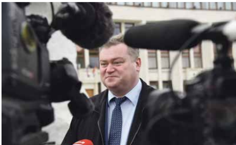
■ Олег Калугин

Это довольно интересный момент, потому что к его непосредственному руководителю – министру внутренней политики и массовых коммуникаций Олегу Калугину у аппарата губернатора явно есть претензии.