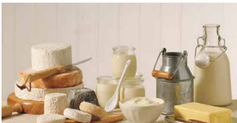
■ С ноября молочная продукция должна будет проходить сертификацию

До этой даты у российских водителей есть право заменить бумажный паспорт на электронный на добровольной основе.