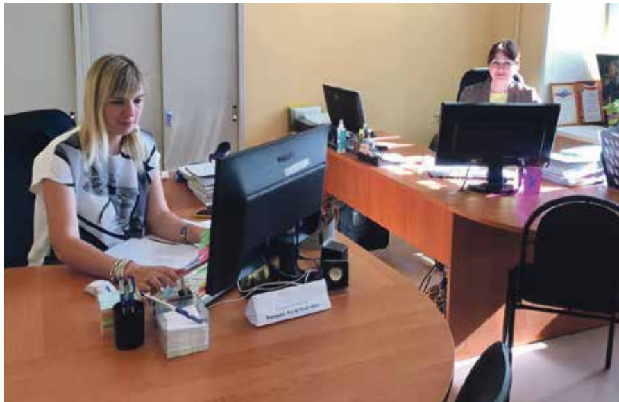
■ Сотрудники отдела опеки

— Конечно, в основном граждане хотят усыновить маленьких детей в возрасте с рождения до 3 лет. Для родителей важно пройти с ребенком все фазы развития, участвовать во всех его начинаниях, видеть, как малыш начинает ходить, говорить, пойти с ним вместе в детский сад и школу. Есть семьи, которые готовы взять детей и старшего возраста.