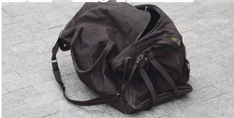
По поводу таких вот забытых сумок жители Обнинска звонят диспетчерам службы 112 до 10 раз в месяц

К тому же, если не брать в расчет человеческие ресурсы, а взять только материально-технические, один ложный вызов обходится пожарной службе в тысячу рублей. А штраф за него варьируется от полутора до двух тысяч рублей.