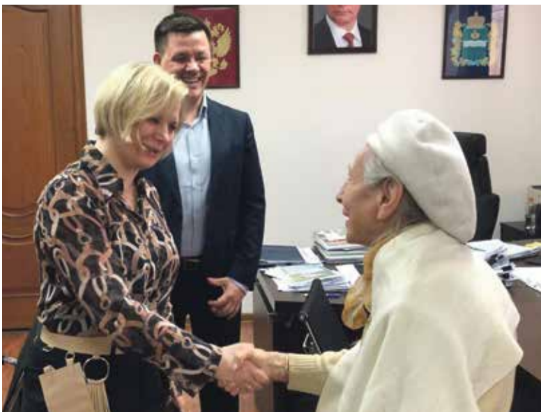
■ Обещать — не значит выполнять

Прекрасно, что у нас есть повод вспомнить Владимира Храброго, но не пришло ли время вспомнить о том, что мы обязаны передать детям весь исторический спектр? И желательны в доступных для детей формах.