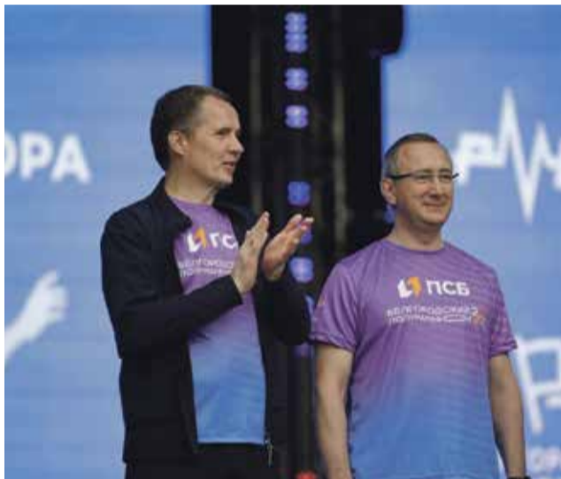
■ А уже через день на марафоне в Белгороде

Впервые на Калужском космическом марафоне провели эстафету среди муниципальных образований. Самыми спортивными в своих группах стали Обнинск, Перемышльский и Мосальский районы.