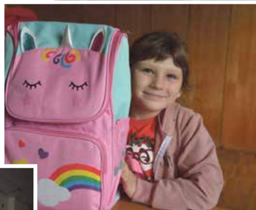
■ Приятно получить к началу учебного года новый рюкзак