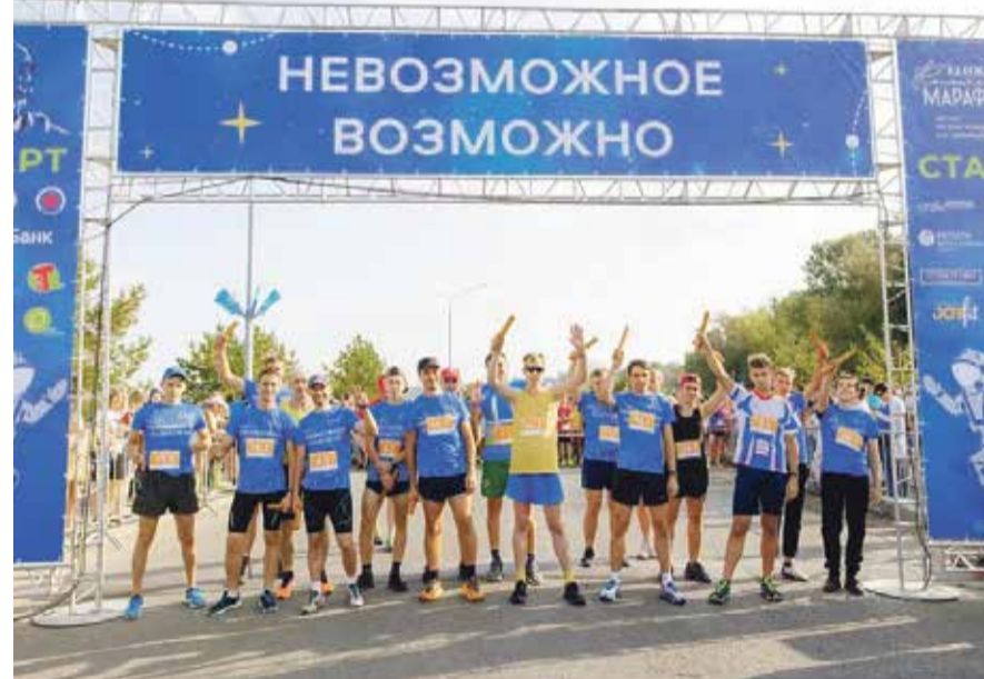
■ В Белгороде в забеге приняли участие около семи тысяч человек