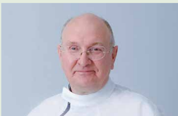
Врач ведет прием в медицинском центре «ЦЕНТР РЕАБИЛИТАЦИИ» в Обнинске на улице Любого, 2. Запись на прием и консультацию по телефону: 9 (48439) 4-32-10.

Его огромный опыт, знания, отточенные годами практики, навыки врача-хирурга, бесконечное чувство прекрасного сможет сделать из вас настоящее произведение искусства!