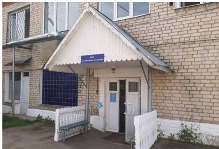
Малоярославецкая станция по борьбе с болезнями животных

Птичий грипп, как говорят в народе, подкрался незаметно. И если в других муниципалитетах было выявлено по одному очагу этого заболевания, то в Малоярославецком районе — сразу пять. Уж не повезло, так не повезло. Тем не менее, малоярославецкие ветеринары с этой сложной проблемой справились успешно.