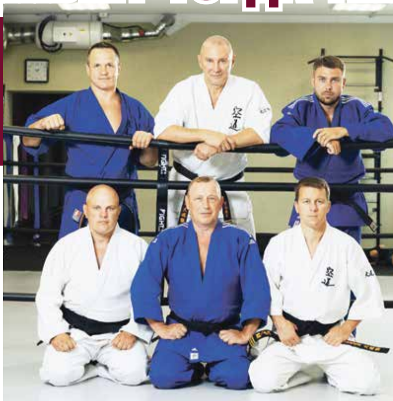
■ Тренеры СШОР «Держава» ждут будущих чемпионов

С ШОР «Держава» — кузница спортсменов высокого класса и профессионализма. Именно отсюда выходят будущие чемпионы по кудо и дзюдо. Именно здесь ценится любовь к боевым искусствам не просто как к возможности стать сильнее и выносливее, но и как к философскому пути, пройдя который, ты обязательно научишься быть мудрым, ответственным и всегда готовым прийти на помощь.