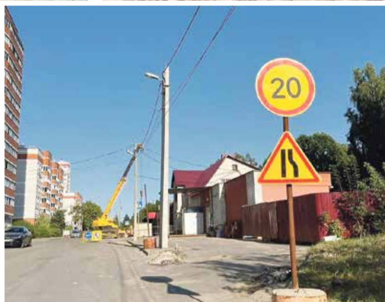
■ Замена труб на улице Королева