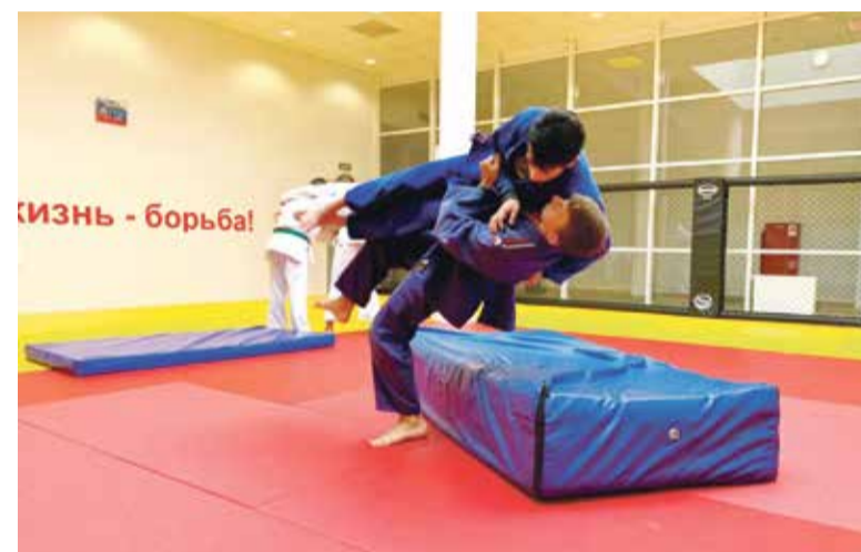
■ Спортсмены готовятся к новому сезону