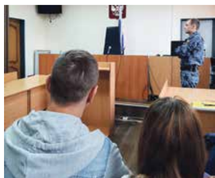
■ Перед началом последнего заседания суда по делу о ДТП с двумя погибшими

Напомним, что иномарка Ауди, в салоне которой находилось четверо молодых людей, врезалась в грузовик МАН, двигавшийся с небольшой скоростью в правом ряду. Со слов водителя грузовика, его машина была груженная и в горку ехала со скоростью около 60 километров в час. Однако, как он отме-