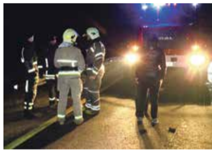
■ ДТП на «Киевке» 1 ноября

— Считаю, что за две отнятые жизни 9 лет мало, — ответила женщина.