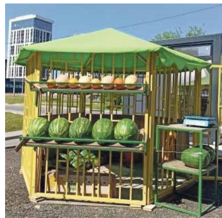
■ Незаконная торговля бахчевыми в Обнинске