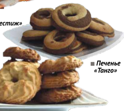
■ Печенье «Танго»

Активно развивают здесь и линейку печенья. Жители Обнинска и соседних районов уже успели оценить вкус печенья «Танго» и «Песочное кольцо».