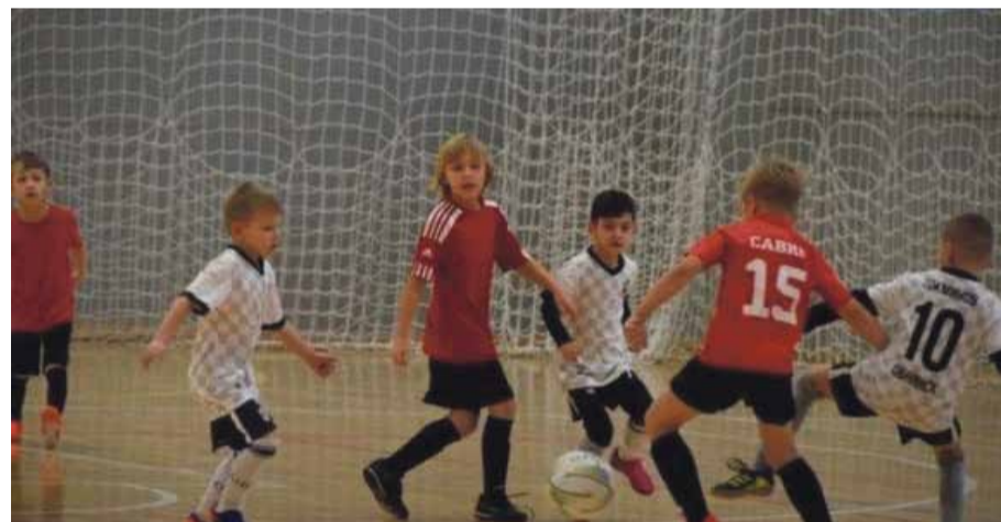
■ Футбол развивает детей всесторонне