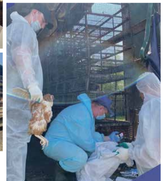
■ Работают специалисты комитета по ветеринарии Калужской области

Специалисты Россельхознадзора выявили нарушения требований ветеринарного законодательства