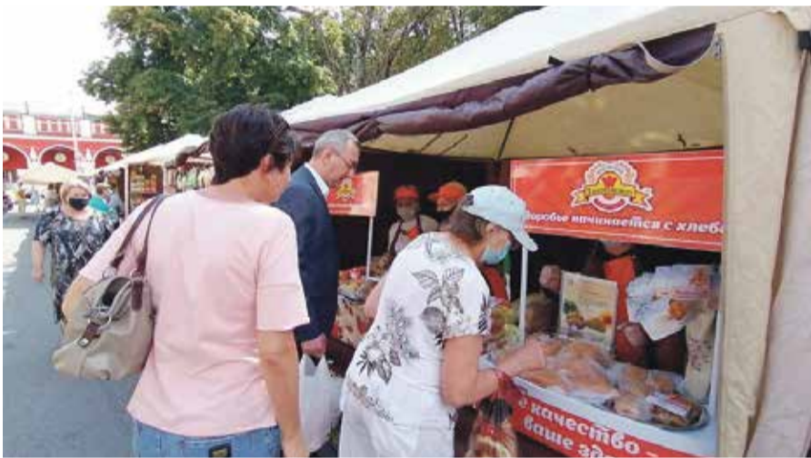
Кстати, губернатор и сам покупает продукты на ярмарках

Мысль губернатора предельно проста: сама суть ярмарок заключается в том, чтобы дать возможность людям покупать сезонные товары недорого, а производителям иметь прямой доступ к покупателям.