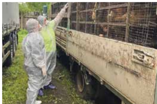
■ Кур пытались вывезти из Калужской области

— Мы приезжаем к таким хозяевам, а кур у них уже нет — все съедены. И что мы можем сделать в такой ситуации? — разводят руками специалисты комитета по ветеринарии.