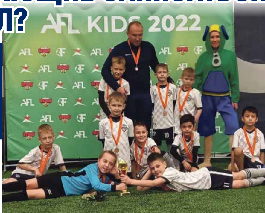
■ Скоро юных футболистов в Обнинске станет больше

В обнинской школе по спортивной гимнастике Ларисы ЛАТЫНИНОЙ открывается отделение детско-го футбола. В связи с чем туда объявлен набор мальчиков от 5 до 14 лет, то есть тех, кто родился с 2008 по 2017 годы.