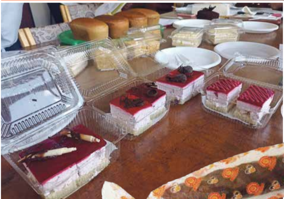
■ Пирожные с суфле