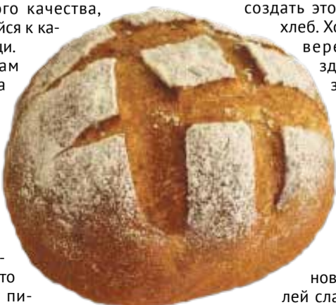
■ Хлеб «Княжеский»