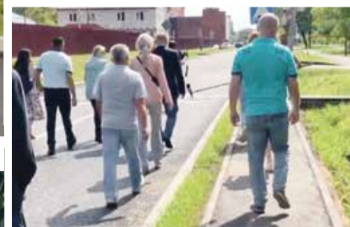
■ Приемка улицы Циолковского