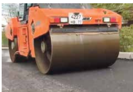
■ Ремонтируют улицу Циолковского