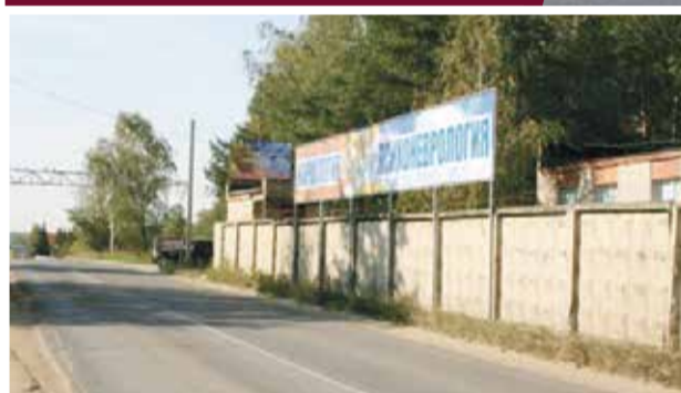
■ Пяткинский проезд

В Обнинске продолжается ремонт дорог в рамках нацпроекта «Безопасные и качественные автомобильные дороги». И, к сожалению, подрядчики показывают себя не с лучшей стороны. Хотя этого и следовало ожидать. В одном из прошлых номеров нашей газеты мы высказывали опасения по поводу прошлых «косяков» новой организации, которая взялась за приведение в надлежащий вид Пяткинского проезда.