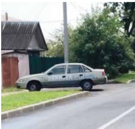
■ Отремонтированная улица Циолковского