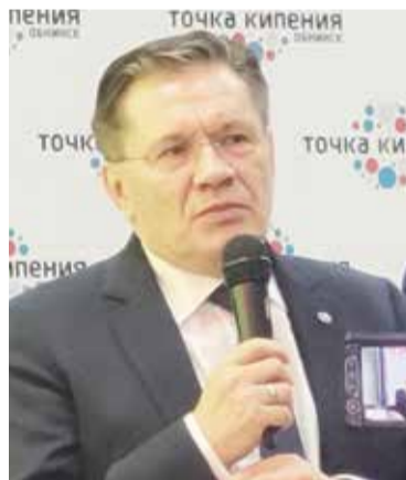
■ Глава корпорации Росатом Алексей Лихачев

собирается не только разговаривать, но и помогать материально. Для этого в самое ближайшее время будет составлен список из 15 городов, куда пойдут деньги на исполнение пилотных проектов по облагораживанию городской среды обитания.