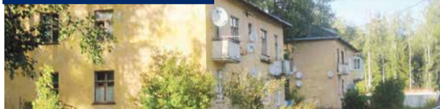
■ Ветхие брусчатki удручают своим видом

Ж ители 11 обнинских двухэтажных многоквартирных домов микрорайона Мирный устали ждать, когда их переселят в обещанные новые квартиры. Проблема эта не решается уже много лет, но люди не теряют надежду. А на днях они получили обнадеживающий ответ на свое письмо из городской администрации.