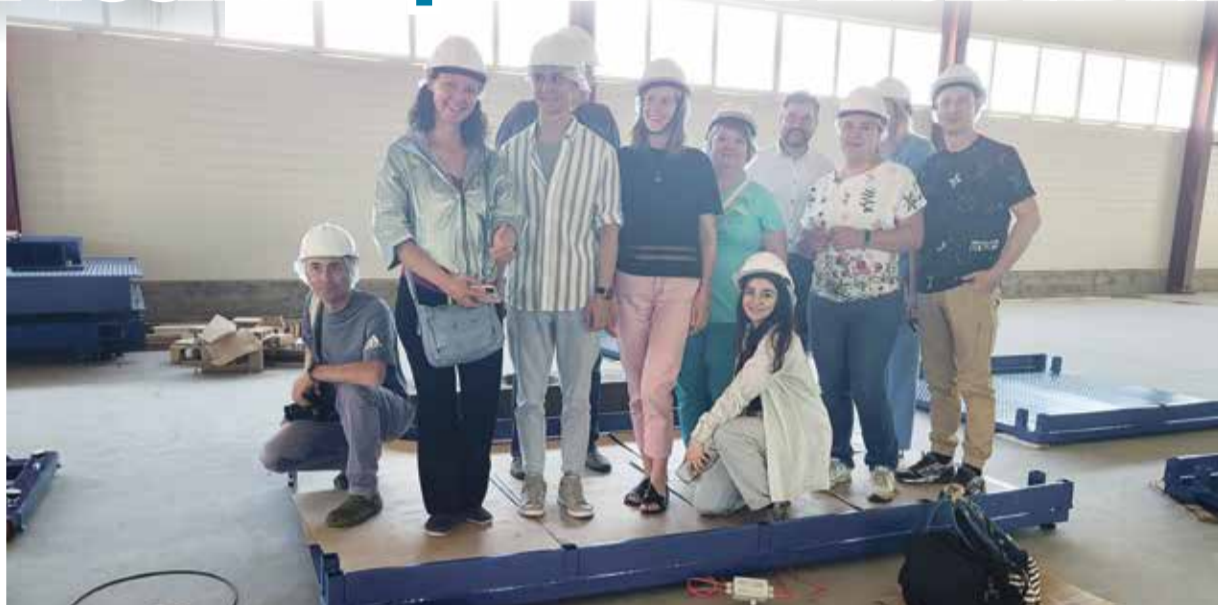
■ Больше тонны журналистов пришли на предприятие МЕТРА

П ока одни жители нашей страны впадают в депрессию от санкций и современного мироустройства, горько плача по чипам и регулярным отдыхам «в европах», другие граждане методично работают, строя для всех нас будущее, в котором Россия будет высокотехнологичной передовой страной, жизнь в которой будет комфортной для ее граждан. Времена обвала глобальной экономики не помешали руководителям обнинских организаций развивать бизнес, разрабатывать импортозамещающие продукты, активно экспортировать и выходить на новые рынки, гибко реагируя на любые политические изменения. Одно из таких предприятий — ООО НПП «МЕТРА». Станут ли амбициозные планы реальностью?