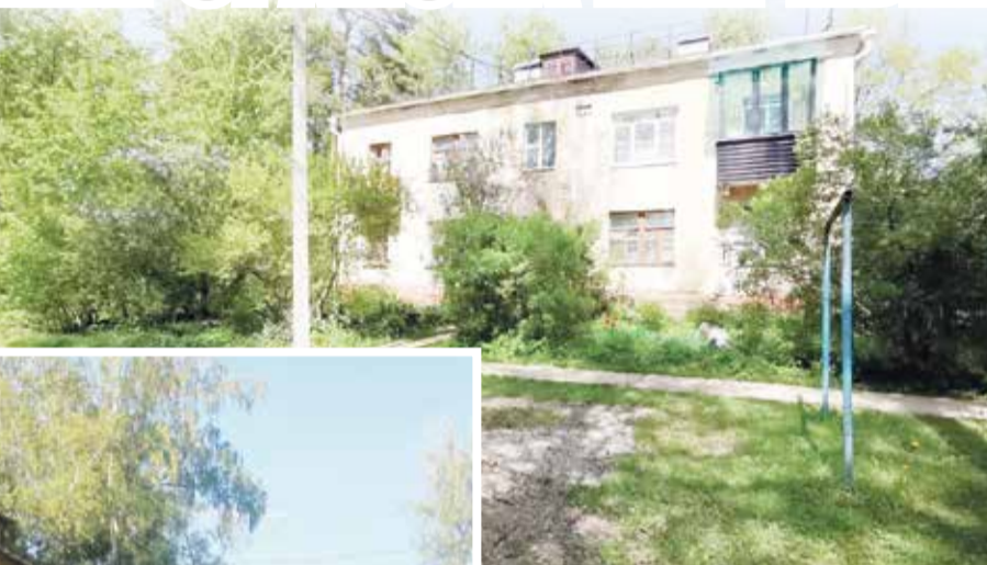
■ Жители микрорайона устали ждать переселения

считает, что было бы неплохо построить в Мирном прямо между старыми деревянными двухэтажками, которые будут сносить, новые четырехэтажные дома.