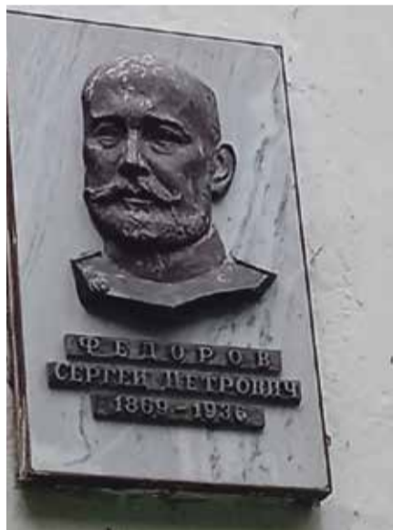
■ Мемориальная табличка напоминает о том, что дом принадлежал доктору Фёдорову

врачей своего времени, автором новых методов диагностики и операций, а также хирургических инструментов. Многие зарубежные технологии он вывозил из Европы и внедрял в России. Кроме урологии, внес огромный вклад в развитие брюшной хирургии, нейрохирургии и анестезиологии в нашей стране.