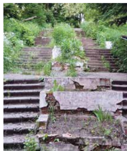
■ Так выглядит лестница знаменитого особняка

А особняк Воробьево является частной собственностью, хотя это объект культурного наследия регионального значения. Он принадлежит санаторию, поэтому местные краеведы никак не могут решить данную проблему. Потом, через годы, эту тему наверняка поднимут, но боимся, что будет уже очень поздно.