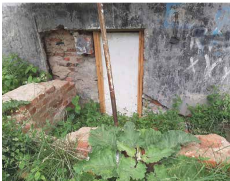
■ Вот так выглядит вход в подвал пятиэтажки поселка Малоярославец-5

В настоящее время идет процесс перевода этого дома на спецсчет. Конечно, это нужно было сделать рань-