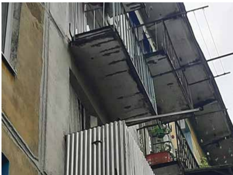
■ На такой балкон выходить страшно

Во всех этих проблемах нужно разбираться муниципалитету совместно с управляющими компаниями и Фондом капремонта. А у нас жителям советуют бороться. Стоит напомнить, что такая борьба отнимает у людей душевные силы и здоровье. А это, уважаемые коммунальщики, тоже деньги, которые никто не вернет.