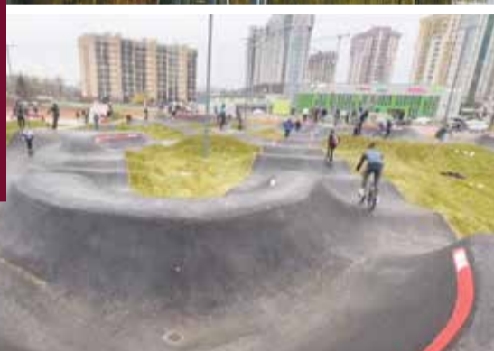
■ Скейт-парк также на балансе Городского парка

На баланс муниципального учреждения он был передан совсем недавно, и на данный момент никаких планов по его благоустройству у дирекции нет.