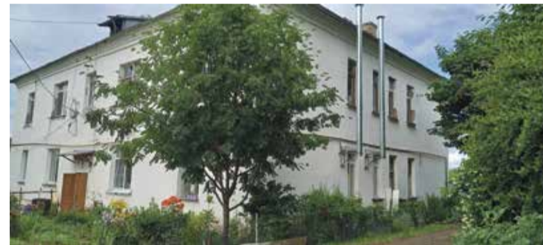
■ Дом № 1 по улице Степана Разина может не дожидаться капремонта

рухнул. Погибли три человека. Видимо, мало. А директор УК отделалась условным сроком. За три человеческие жизни!