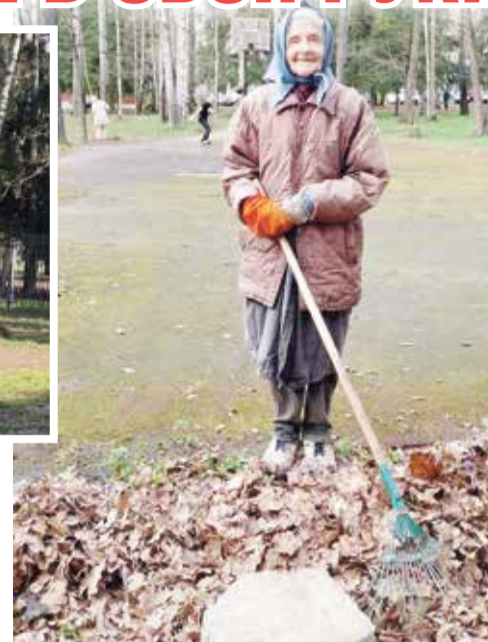
■ Двор убран

Кстати, энергосбережение для МП «УЖКХ» – это не просто слово, а сознательно проводимая политика в отношении всех домов, которые берет в управление данная компания. Замена обычных ламп на светодиодные