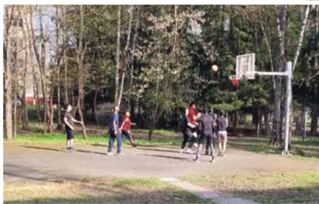
■ Новая баскетбольная площадка

Зима в этом году выдалась снежной, и первое, что сделала муниципальная управляющая компания – это вычистила двор от снега до самого асфальта и обработала противогололедными средствами, чему жители были несказанно рады, так как трактора здесь не видели лет пять. А глубокая колеяность, то есть деформация всей конструкции дорожной сети, всегда приводит к травмам людей и досадным повреждениям автотранспорта.