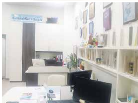
■ В турагентствах сейчас затишье

В этом случае отдых, как нам кажется, пострадал незначительно. Но, вероятно, и у этих отдыхающих жителей наукограда остался неприятный осадок.