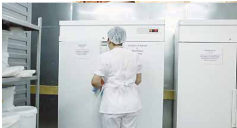
■ В цехах обнинского хлебокомбината

Доставка хлебобулочных изделий обнинского хлебокомбината осуществляется по торговым точкам наукограда и соседних районов согласно графику. Покупатели с нетерпением ждут эту продукцию и раскупают ее довольно быстро. Так что санкции этого предприятия никак не коснулись. Там по-прежнему трудится 312 человек, и никого сокращать не планируют.