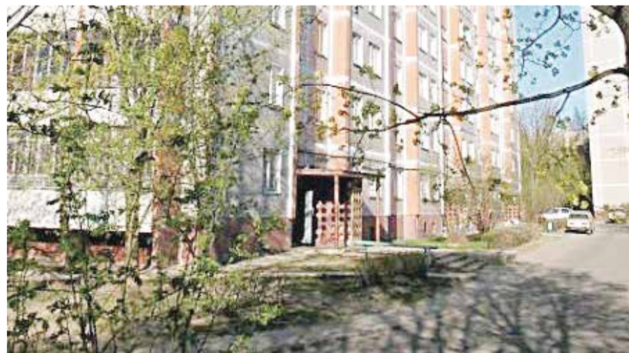
■ Жителям Энгельса, 30 в этом году повезло

А что касается расходов на обычное городское благоустройство, то они будут корректироваться с учетом инфляции.