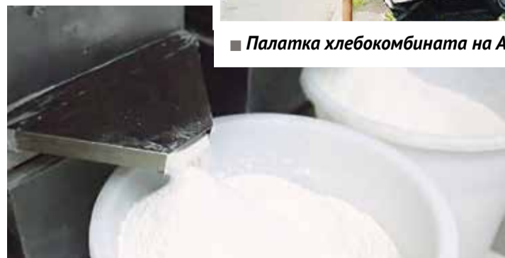
■ Мука используется самого высшего качества