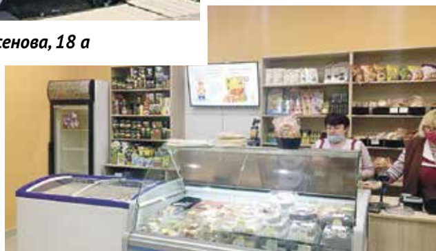
■ Продукция хлебокомбината