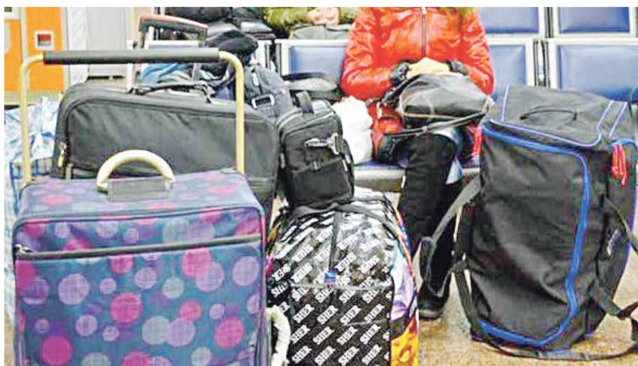
■ Обнинских туристов пришлось эвакуировать из Доминиканы раньше срока

При обращении необходимо указать наименование товара, его вес/объем, когда и насколько изменилась цена, а также полную информацию о продавце товара: ИНН, наименование, адрес. Эта информация размещена в «Уголке потребителя» в магазине, а также на товарных чеках.