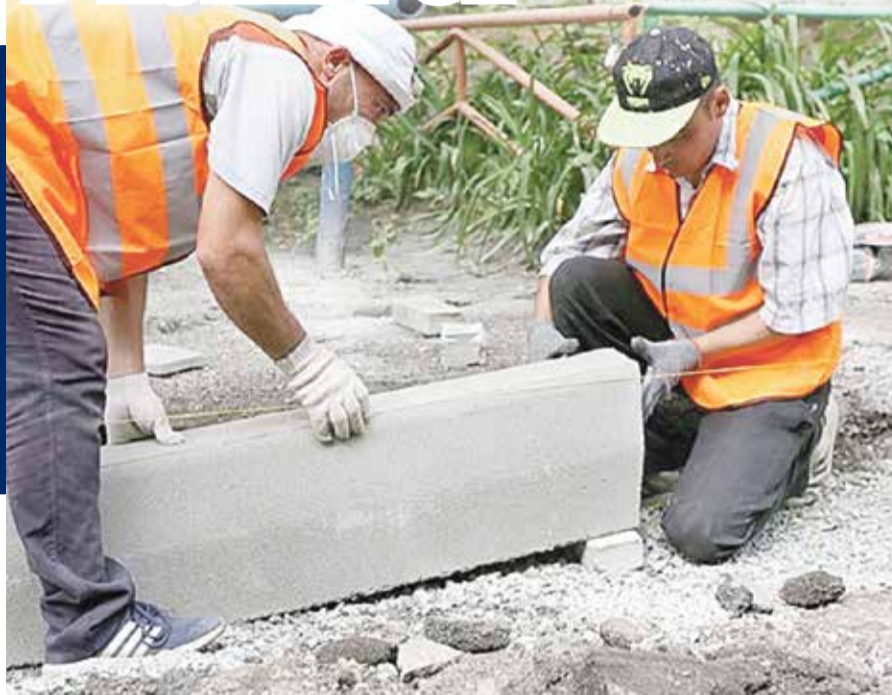
■ Обнинские ТОСы подали заявки на благоустройство своих территорий

Как он пояснил, всего на данные работы по благоустройству будет затрачено около