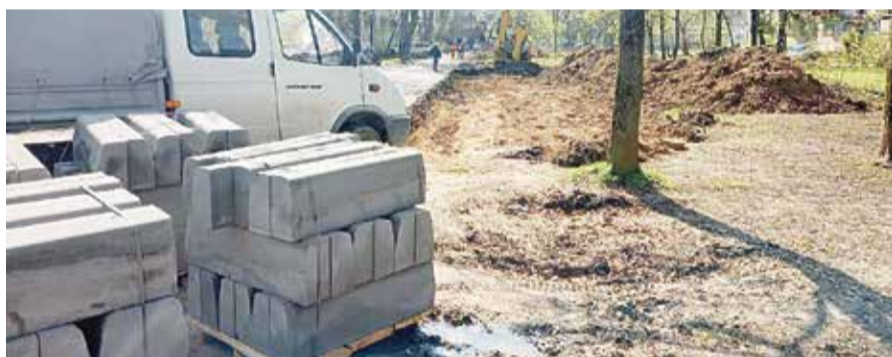
■ В Обнинске ежегодно благоустраиваются дворы по программе ТОС

полтора миллионов рублей. Остальные средства предоставят спонсоры, какую-то часть работ проведут сами жители.