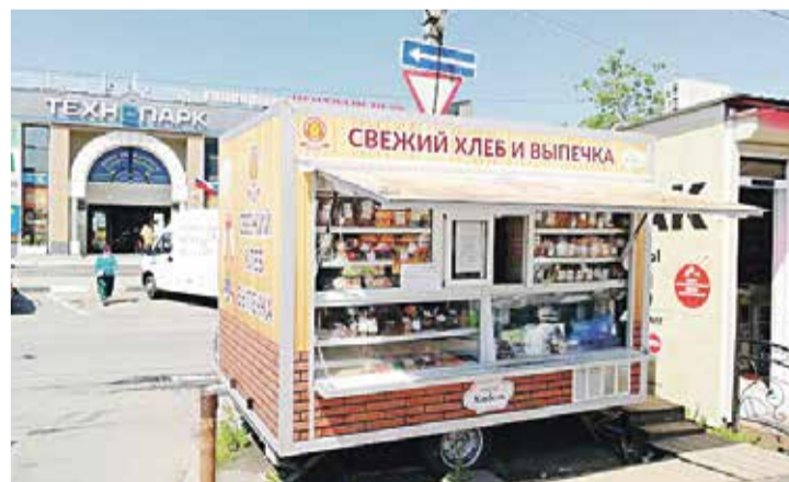
■ Палатка хлебокомбината на Аксенова, 18 а