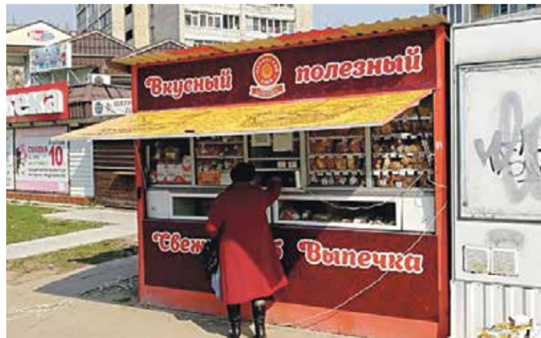
■ Палатка обнинского хлебозавода на Энгельса, 34