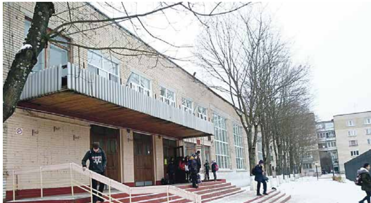
Школа № 9, в которой разгорелся скандал между мамой ученика и педагогами

Как мы поняли, если охранник не удалится на обход территории, он обязательно разрешит родителям пройти в здание при наличии у них документа, удостоверяющего личность. А если сторожа вдруг не окажется на месте, то проблемы нет вообще. Во всяком случае, пока нет.