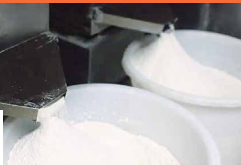
■ Мука используется самого высшего качества