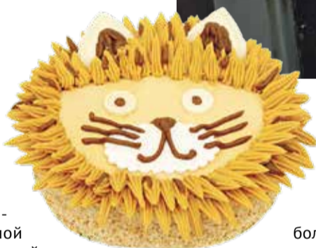
■ Торт Сладкоежка

Для них придумывают и выпекают более яркие и необычные тортики. В этом году ими стали «Любимый» – в виде мордочки собачки, «Сладкоежка» – в виде львенка и «Сластена» – в виде тигра – символа наступающего года. Малыши от этих новинок приходят в восторг.