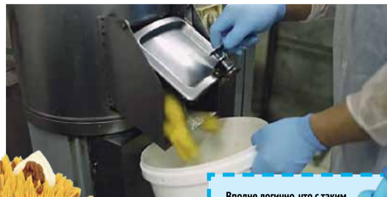
■ Работа кипит