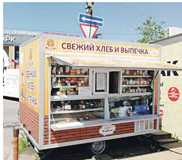
■ Палатка хлебокомбината на Аксенова, 18 а