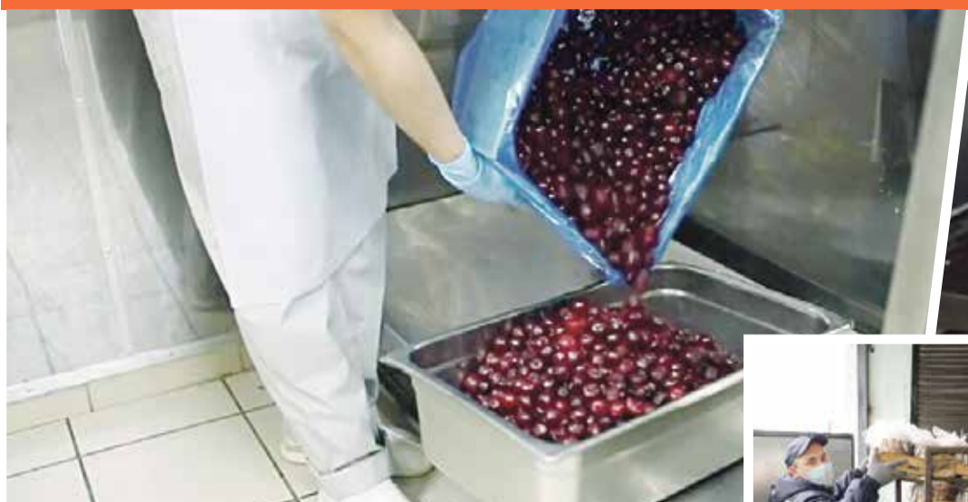
■ Ягоды для тортов и пирожных привозят свежими