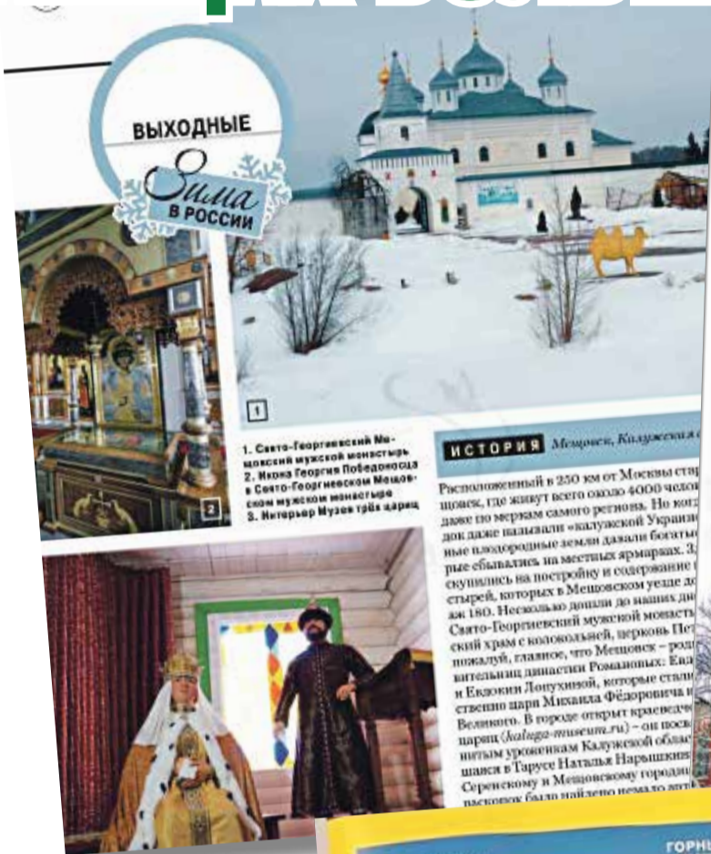
■ Мещовск в журнале