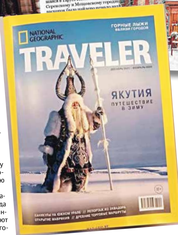
■ Обложка свежего выпуска