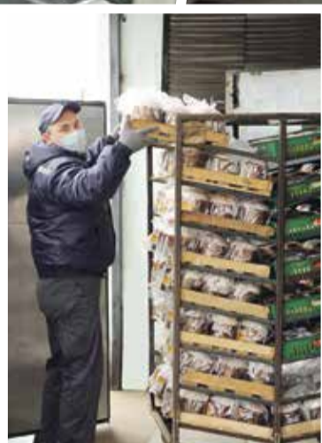
■ А в праздник Пасхи здесь выпекают ароматные и воздушные куличи