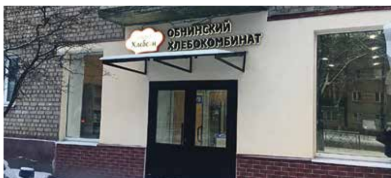
■ Магазин обнинского хлебокомбината на Курчатова, 2