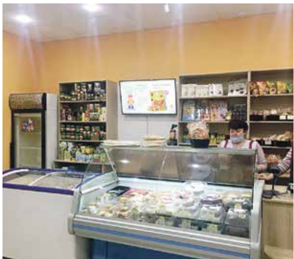
■ Продукция хлебокомбината

«Перекресток», «Праздничный», «Лента» и другими.