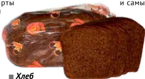
■ Хлеб солодовый