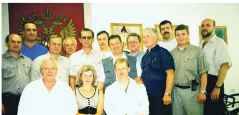
Коллектив Центра реабилитации — 90-е годы