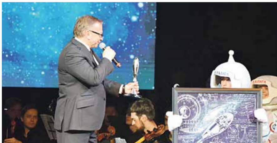
■ Кинофестиваль в 2021 году