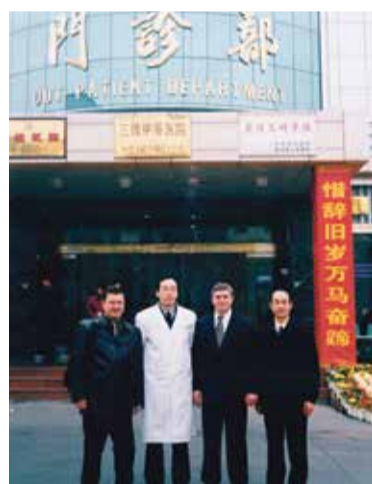
Обнинские врачи с китайскими коллегами

В 1996-м году, когда в «ЦЕНТРЕ РЕАБИЛИТАЦИИ» открыли хирургическое направление и была получена лицензия, он превратился в полноценную поликлинику.