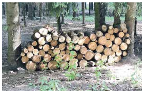
Двор на Курчатова, 47/1

А вообще приносить на эти акции также можно мелкую бытовую технику, тетрапак, контейнеры от еды из полистирола и ПЭТ, зубные щетки, разрезанные и промытые тюбики от пасты и кремов, банковские и дисконтные карты, фольгу, чеки, пробки от вина, клипсы от хлебных пакетов, фольгированную упаковку, бумажные пакеты, рентгеновские снимки, линзы от очков и многое другое.