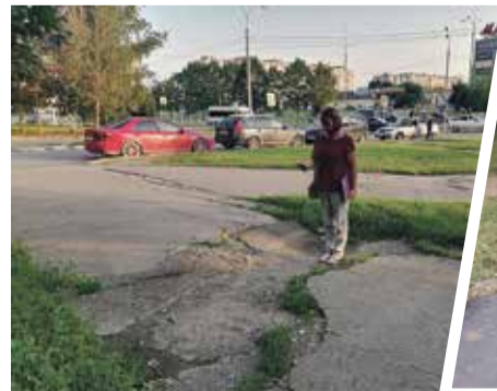
■ Гагарина, 2. Было.

Если говорить о конкретных делах и результатах, то сегодня, например, выполнен ямочный ремонт по улице Гагарина, 16. Также на столбах освещения поменяли лампочки, где это было возможно.