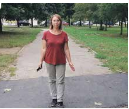
■ Гагарина, 2. Стало.

На этой неделе пришла бумага, что кафе «Сундук» прекратило свою деятельность.