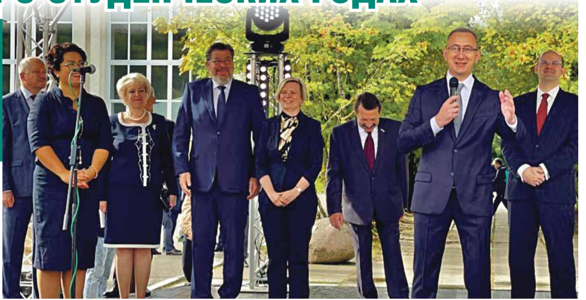
■ Шапша назвал Обнинск лучшим городом земли

О том, что ИАТЭ — кузница самых классных кадров не слышал, пожалуй, только ленивый. Выпускники института работают на ведущих предприятиях страны и области, уезжают за границу строить атомные станции. В общем, становятся, что называется, специалистами с большой буквы в своей сфере. Сегодня крупные работодатели из Калужской области готовы в прямом смысле торговаться за будущих специалистов, предлагая нынешним первокурсникам стабильное будущее. Представители предприятий заранее уверены, что из ИАТЭ не выходят неликвидные кадры.