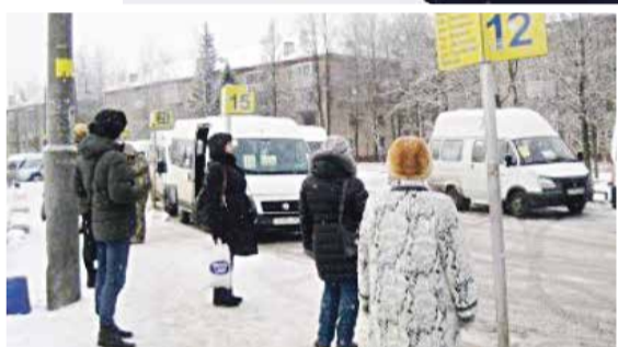
Пассажиры всегда хотят видеть вежливое к себе отношение со стороны водителей

в весьма хамской манере и демонстративно открыл дверь микроавтобуса.