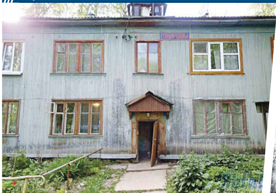
■ Дома в Мирном находятся в весьма плачевном состоянии