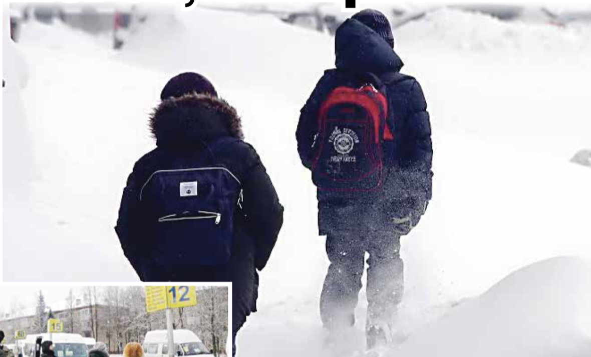
Школьников стали часто выгонять из маршруток

— Твои проблемы, что у тебя нет наличных! — парировал шофер