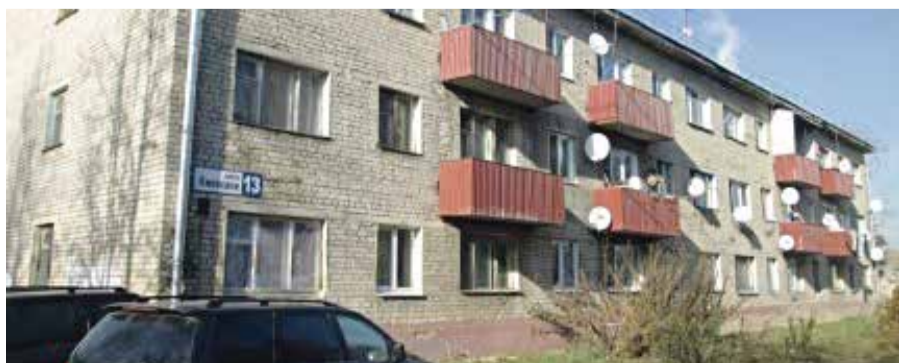
■ Дом на Киевской 13