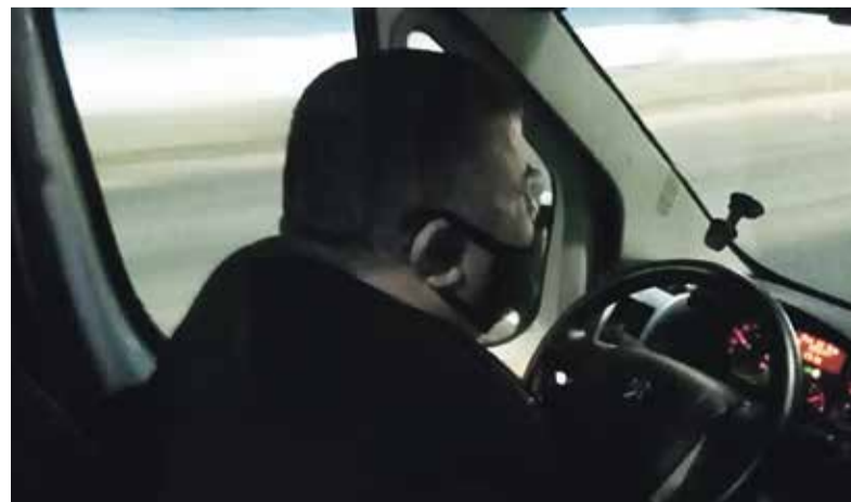
Тот самый водитель «тройки»

— Если факт подтвердится, то водителя накажут самым строжайшим образом, — заверила нас руководитель автотранспортного предприятия.