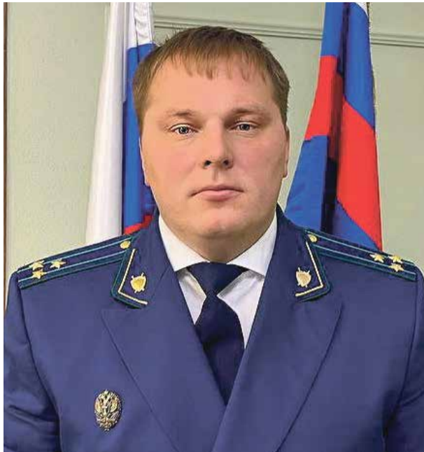
■ Прокурор Обнинска Павел ГИЛЬДИКОВ

Схема, по которой работают преступники, отретпетирована максимально четко. Вам звонит якобы сотрудник службы безопасности банка и начинает рассказывать, что с вашей карты прямо сейчас кто-то пытается снять деньги. Или вы уже их кому-то перевели, активность показалась подозрительной, и вот сердобольные безопасники предупреждают владельца об угрозе