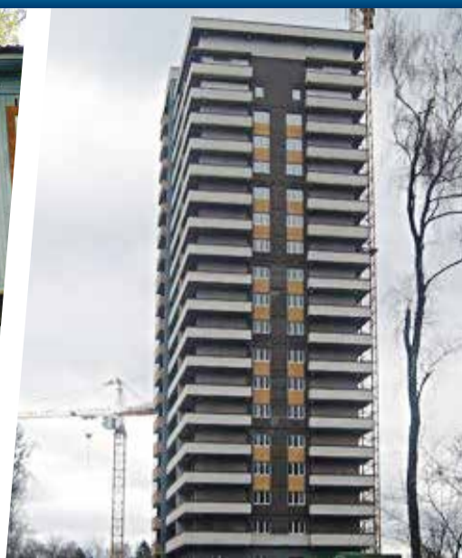
■ Строительство нового дома на Кутузова