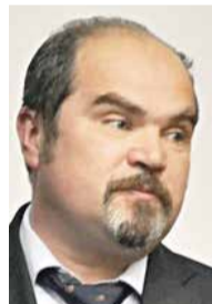
■ Вячеслав ЛЕЖНИН

Данная программа изначально касалась тех домов, которые были признаны аварийными до 1 января 2017 года. А завершить ее предполагалось в 2025 году. Но, как сообщил на заседании областного правительства министр строительства и ЖКХ Вячеслав ЛЕЖНИН, завершится она на два года раньше – в 2023-м.