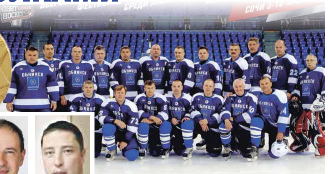
■ ХК «Обнинск» (Обнинск, Калужская обл.)