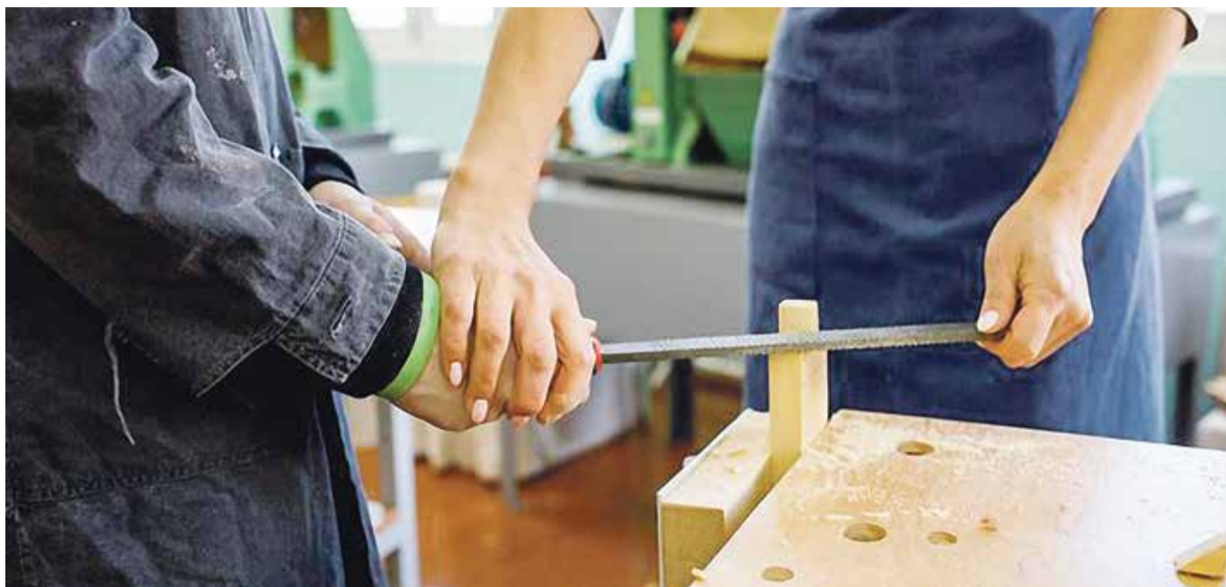
■ На уроке труда

а у кого-то все 27. Многие от большого количества уроков отказываются. И это их выбор.