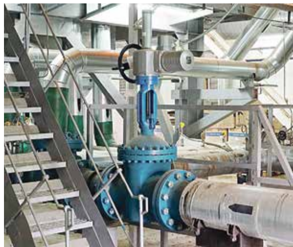
■ В одном из залов Обнинской ГТУ-ТЭЦ