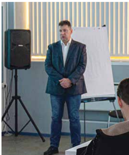
■ Стартаперы представляют свои проекты