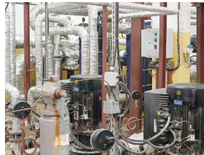
■ В центральном тепловом пункте на ул. Поленова