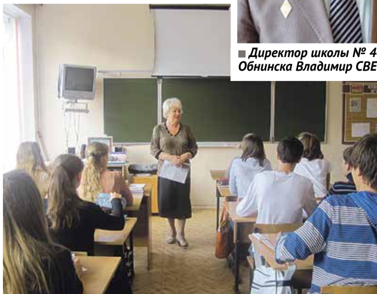
■ Труд учителя – один из самых тяжелых