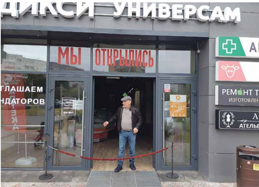
■ Неизвестный выходит из неработающего магазина «Дикси» и раздает указания журналистам