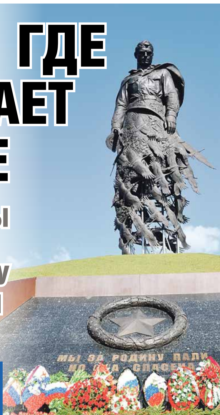
■ Памятник Советскому Солдату