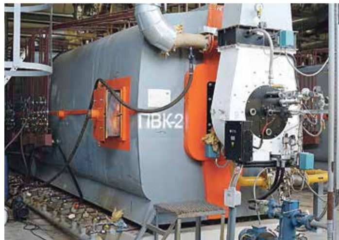
■ Водогрейный котел