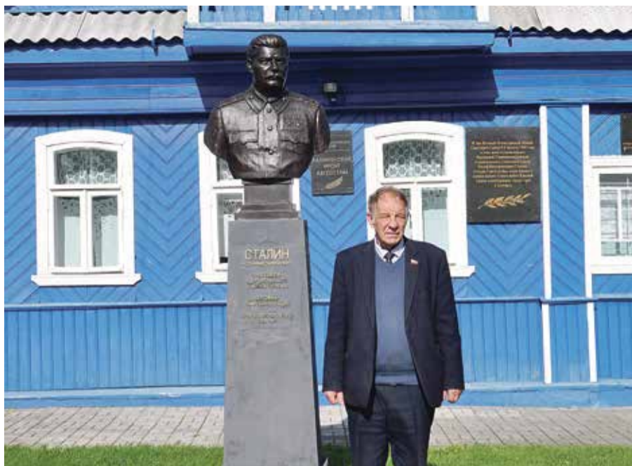
■ В этом небольшом деревянном домике Иосиф Сталин провел ночь с 4 на 5 августа 1943 года и принял решение о проведении в Москве Первого салюта в честь войск, освободивших Орел и Белгород в ходе Курской битвы.

проведено над лицом воина, его выражением — оно менялось несколько раз, прежде чем приобрело те черты, которые мы видим сегодня — мужество, стойкость, скорбь — создателю удалось передать все, — рассказывает Капустин. — Мы возложили венки, цветы, провели небольшой митинг. Все испытали непередаваемые эмоции. Это настолько величественный и символичный монумент, что аж дух захватывает. Надо было видеть лица подростков — абсолютная проникновенность.