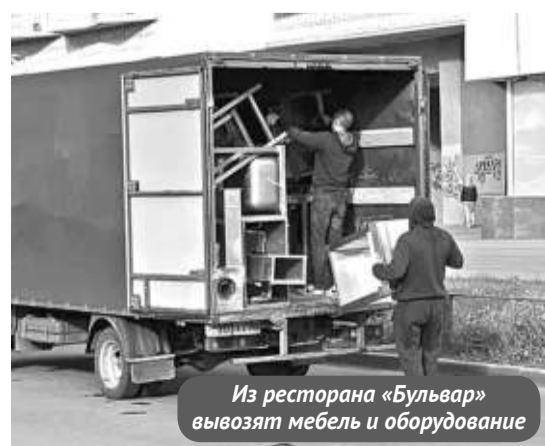
Из ресторана «Бульвар» вывозят мебель и оборудование