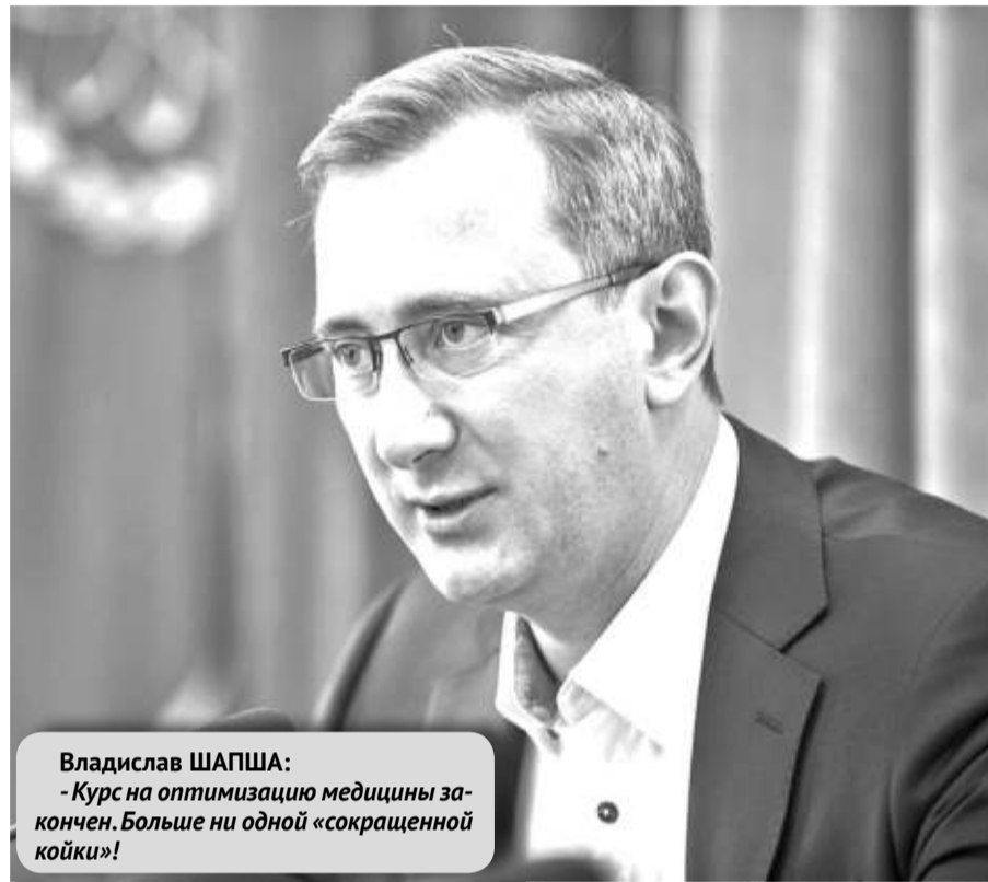
Владислав ШАПША: - Курс на оптимизацию медицины закончен. Больше ни одной «сокращенной койки»!

В настоящее время ведется активная работа по немедленному доведению социальных обязательств государства до адресатов. Тем самым область компенсирует те недоработки по освоению средств, которые были в начале марта, и на которые пенял премьер-министр Михаил Мишустин. Вот только некоторые даты и суммы: - с 30 марта был увеличен максимальный размер пособия по безработице - с восьми тысяч до 12 тысяч 130 рублей;