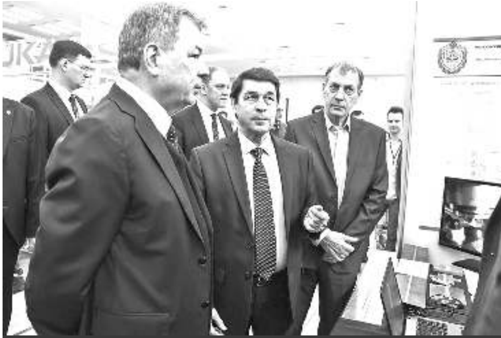
На этой неделе в Калуге прошел промышленный форум, который длился несколько дней. В роли организаторов мероприятия выступили правительство Калужской области, калужская Торгово-промышленная палата и ГАУ КО «Агентство развития бизнеса». В форуме также принял участие глава региона Анатолий АРТАМОНОВ.

ПРОМЫШЛЕННЫЙ ФОРУМ В КАЛУЖСКОЙ ОБЛАСТИ СОБРАЛ ПОЛМИЛЛИОНА ЧЕЛОВЕК