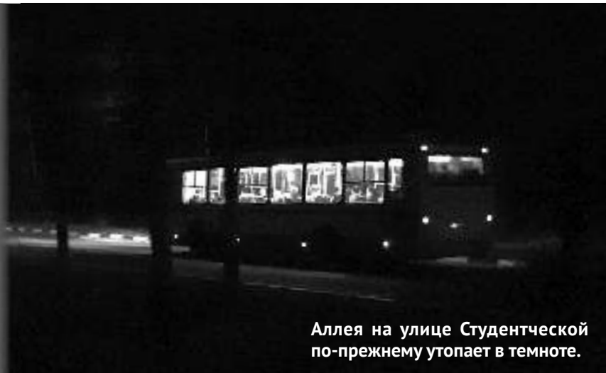
Аллея на улице Студентческой по-прежнему утопает в темноте.

Интересно сколько времени должно пройти или сколько новых жертв еще нужно, чтобы кто-нибудь, наконец, позаботился о безопасности студентов института атомной энергетики? А как иначе объяснить, что по сей день аллея, ведущая к студенческому городку, по-прежнему утопает в темноте, а молодежь продолжает ходить пешком, поскольку общественного транспорта в вечернее время дождаться нереально.