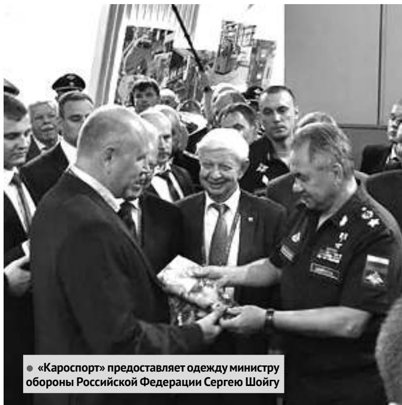
• «Кароспорт» предоставляет одежду министру обороны Российской Федерации Сергею Шойгу

– По своим характеристикам они выше, чем те, которые продаются в магазинах «Адидас», «Найк» и других. – Наша продукция сопровождается не только Декларациями ЕАС, но и международными