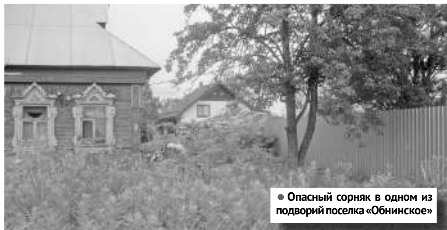
● Опасный сорняк в одном из подворий поселка «Обнинское»

– Хочется отметить, что площадь произрастания этого растения действительно начала сокращаться. Обработка ведется