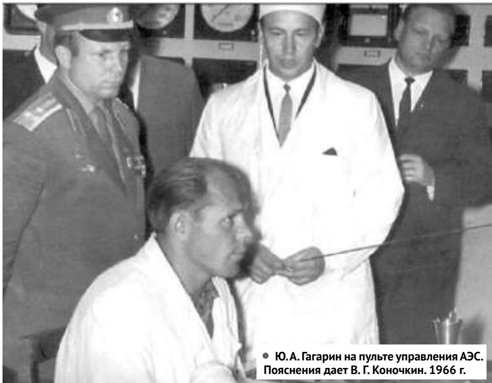
• Ю. А. Гагарин на пульте управления АЭС. Пояснения дает В. Г. Коночкин. 1966 г.

Первая АЭС: вчера и сегодня. Мы продолжаем публиковать материалы в рамках проекта «Мирный атом», посвященного празднованию 65-летия пуска Первой в мире АЭС.