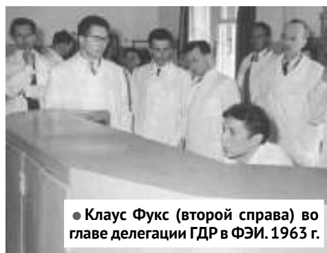
• Клаус Фукс (второй справа) во главе делегации ГДР в ФЭИ. 1963 г.

29 апреля 2002 года Первая АЭС была остановлена. Почти 50-летний период успешной эксплуатации на энергетических режимах реактора АМ подтвердил правильность изначально принятых решений.