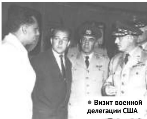
• Визит военной делегации США

В первый период работы АЭС рассматривалась как опытная энергетическая станция. На ней учились и проходили подготовку специалисты первых промышленных станций, экипажи первых атомных подводных лодок и атомного ледокола «Ленин», стажировались специалисты из Германской демократической республики, Чехословакии, Китая, Румынии. Но, начиная с 1956 г., назначение станции стало постепенно меняться. Опыт разработки, создания и эксплуатации Первой АЭС помог более четко определить задачи ближайшего будущего по использованию ядерных реакторов, как в энергетике, так и других промышленных применениях. Реактор решено было исполь-