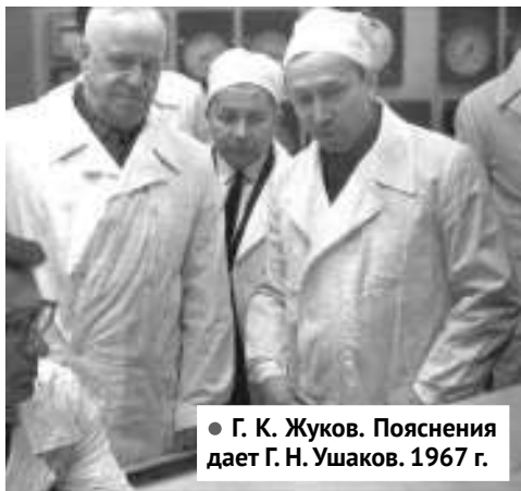
• Г. К. Жуков. Пояснения дает Г. Н. Ушаков. 1967 г.

С 1956 г. Первая АЭС была открыта для посещения советскими и зарубежными делегациями. Только за первые 20 лет ее посетили более 2000 делегаций из 85 стран мира. Это были видные политические деятели, ученые, а также десятки тысяч простых людей.