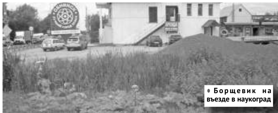
● Борщевик на въезде в наукоград