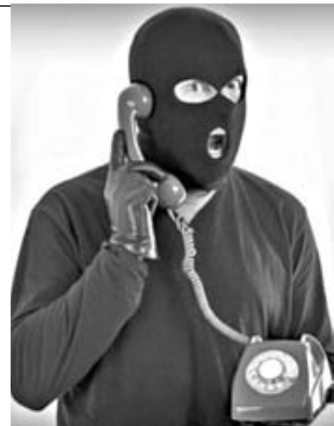
на поводу у мошенников! При обнаружении подобных фактов предпринимателям необходимо обращаться в правоохранительные органы Калужской области.

После телефонного звонка к согласившимся купить брошюру приезжает курьер и забирает деньги. В случае отказа мошенники сообщают о наложении штрафов. К счастью, все чаще предприниматели сомневаются в законности деятельности чиновников-коробейников и сообщают в компетентные органы. Управление Роспотребнадзора по Калужской области обращает внимание предпринимателей, что должностные лица Управления осуществляют проверки исключительно на основании распоряжения, определения о возбуждении дела, при предъявлении служебного удостоверения. Управление Роспотребнадзора по Калужской области сообщает о своей непричастности к данным фактам и призывает не идти